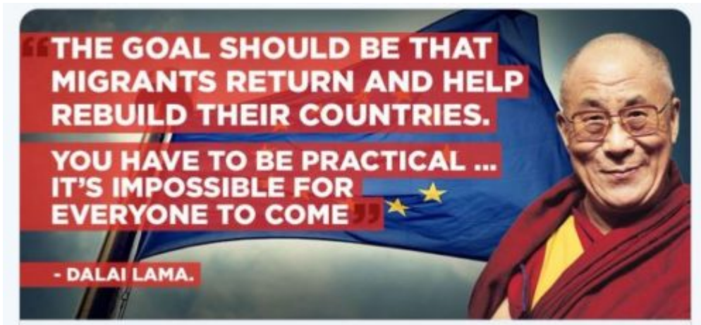
Image ci-dessus : en réponse à une journaliste, le dalaï-lama avait maintenu cette position et estimé que « les pays européens devraient prendre ces réfugiés et leur donner une éducation, une formation.

C'est ce qu'avait dit le chef spirituel des Tibétains, le dalaï-lama il y a deux ans.