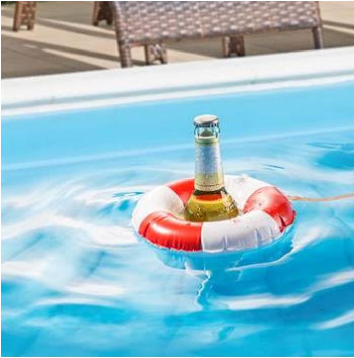
La bouée est berlinoise