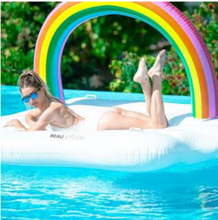
La bouée est LGBT