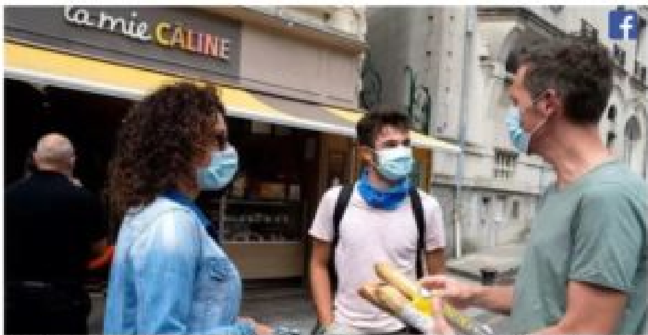
À partir du 3 août 2020, les masques sont obligatoires dans les rues en Mayenne pour éviter la propagation du Covid-19. Ici à Laval, les habitants prennent le pli.