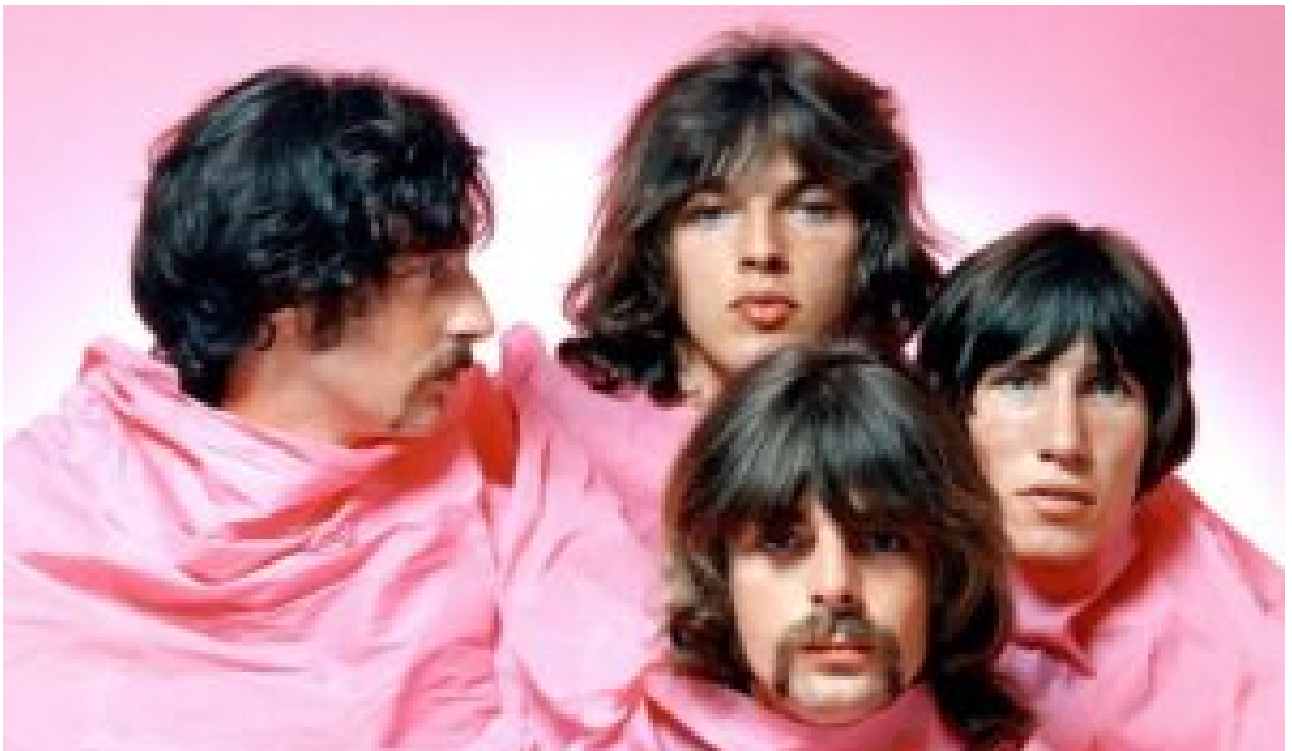
Nick Mason, David Gilmour, Richard Wright et Roger Waters

High Hopes (1994). Beau solo à la guitare Lap-steel à 5'10.