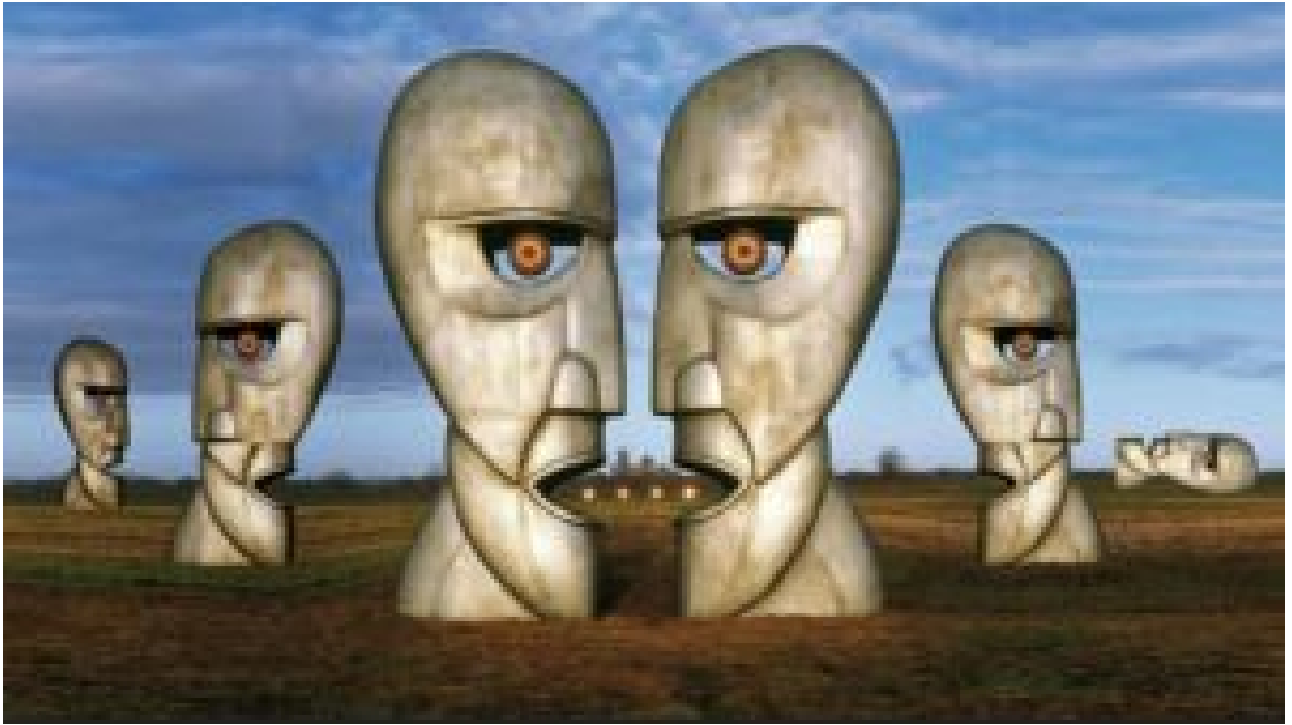
The Division Bell

High Hopes (1994). Beau solo à la guitare Lap-steel à 5'10.