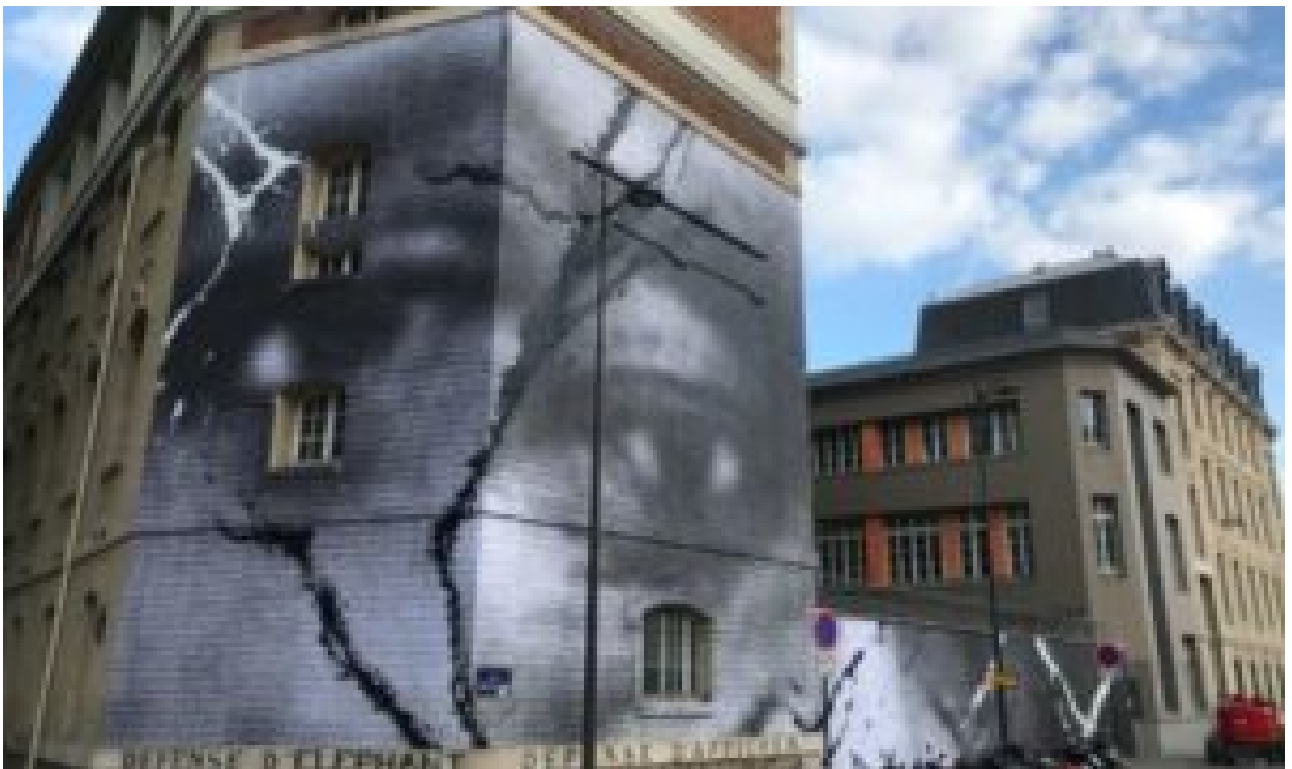
Dans le Xe arr. de Paris, cette fresque est censée