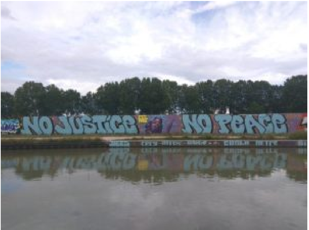
Canal de l'Ourcq