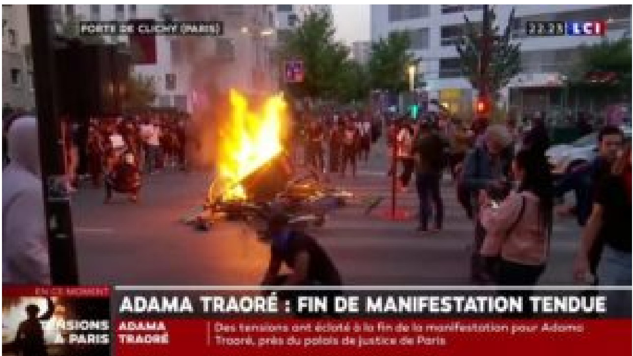
Dégradations et violences en marge des manifestations de juin “contre les violences policières”