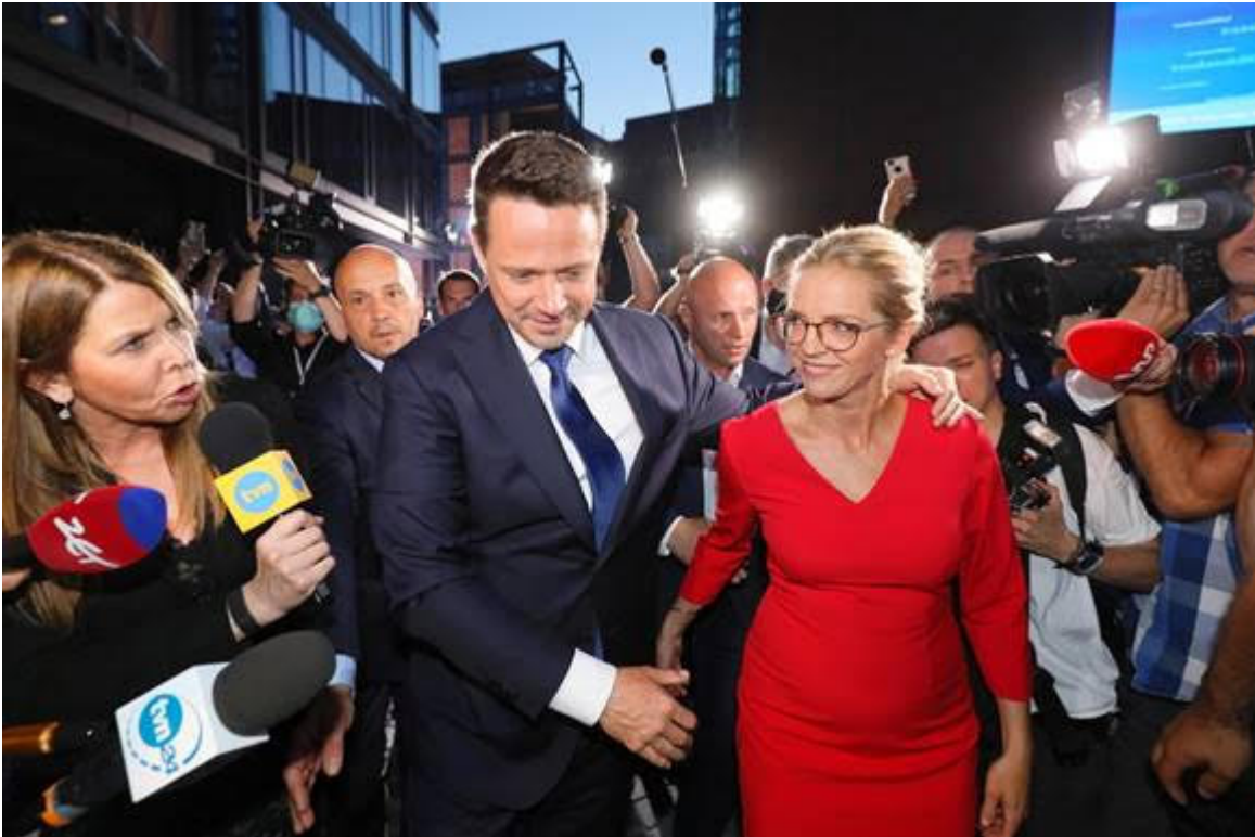
Rafal Trzaskowski 28 juin 2020 : avanti avanti Polonia !