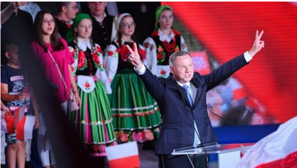
Andrzej Duda en campagne : tradition avant tout !