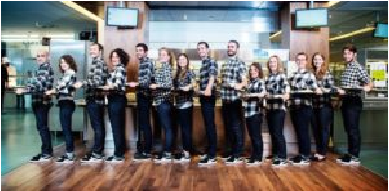
Rédaction de Néon