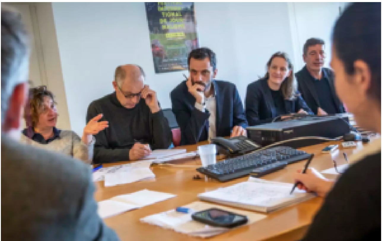
La rédaction TRÈS BLANCHE des gauchos islamo-racio-soumis du Monde