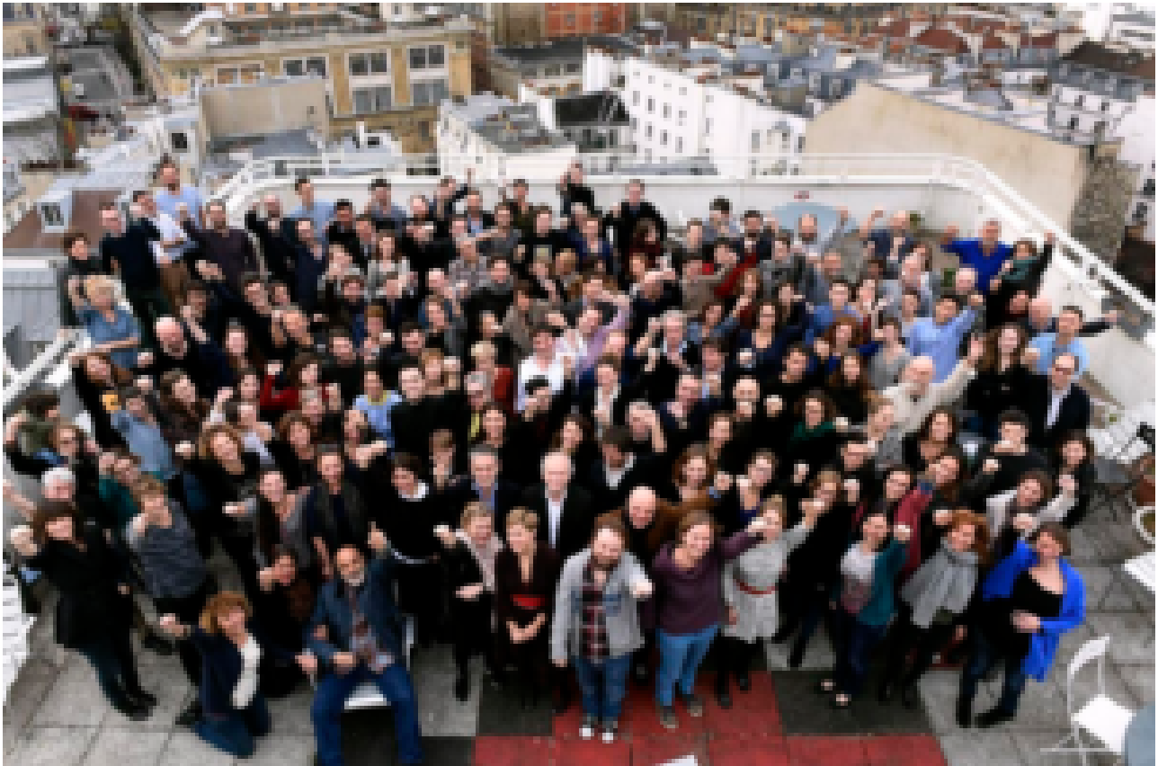
Rédaction de Libération (seul le pigiste est arabe...)

A société multiculturelle, société conflictuelle. Mais dans l'entre-soi des rédactions de gauche, on préfère se voiler la face et vivre dans le déni, la culpabilité et la haine de sa propre blancheur.