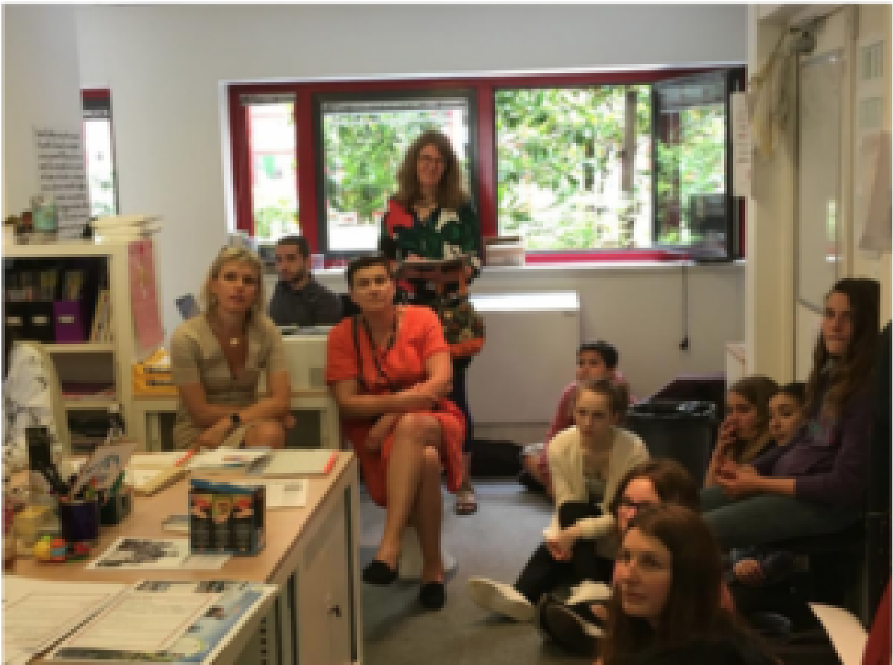
Photo : À la rédaction du Monde des ados © Marion Gillot / Fleurus Presse

Les journalistes de l'Obs phosphorent-ils sur le « racisme systémique » ?