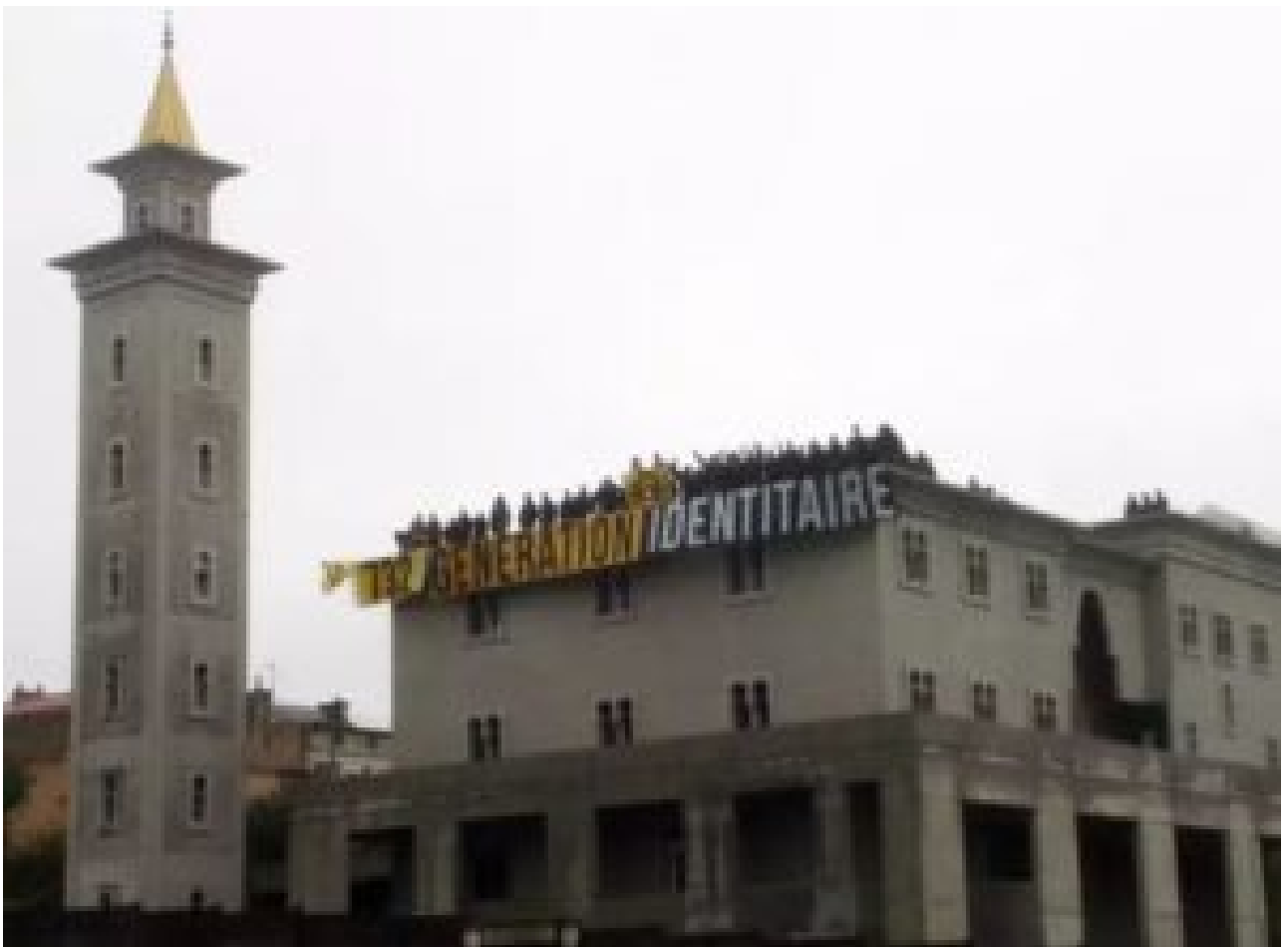
Sur le toit de la future grande mosquée de Poitiers