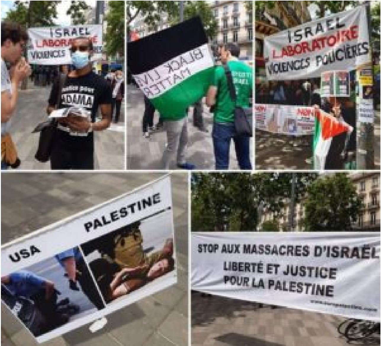
Manifestation, samedi 13 juin, « contre le racisme et les violences policières »...