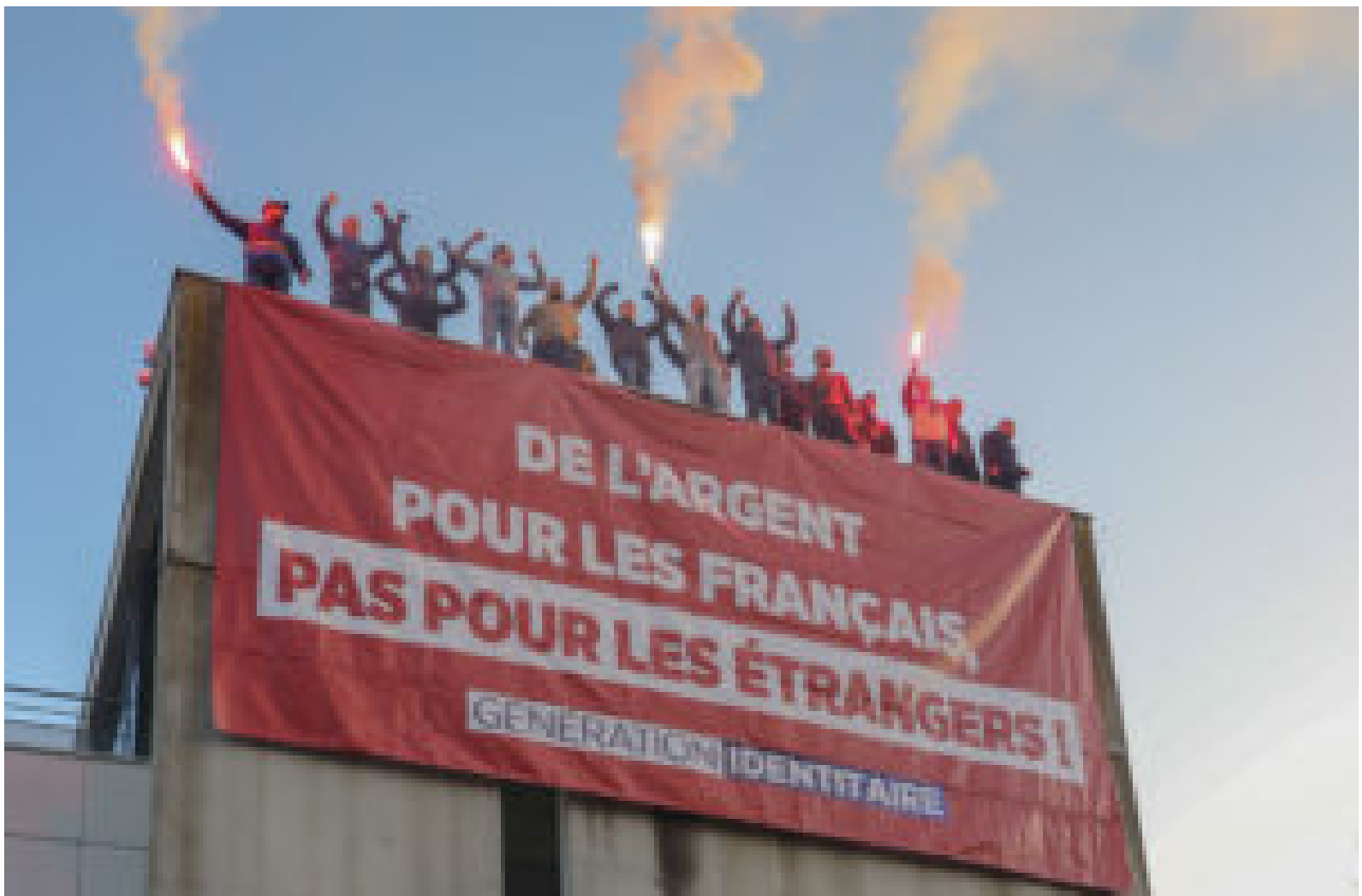
A la CAF de Bobigny