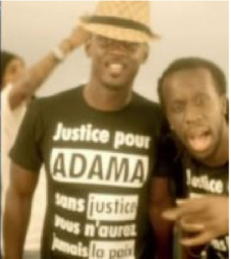
Camélia Jordana appelant « à prendre les armes » et Black M