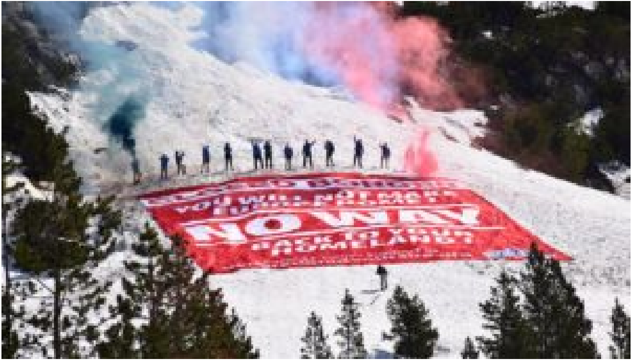
Au col de l'Echelle