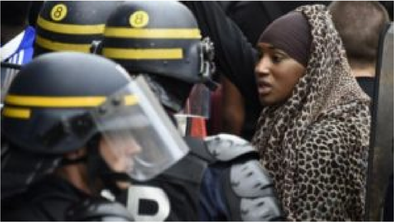
Manifestation de 2016 contre "le racisme d'Etat"