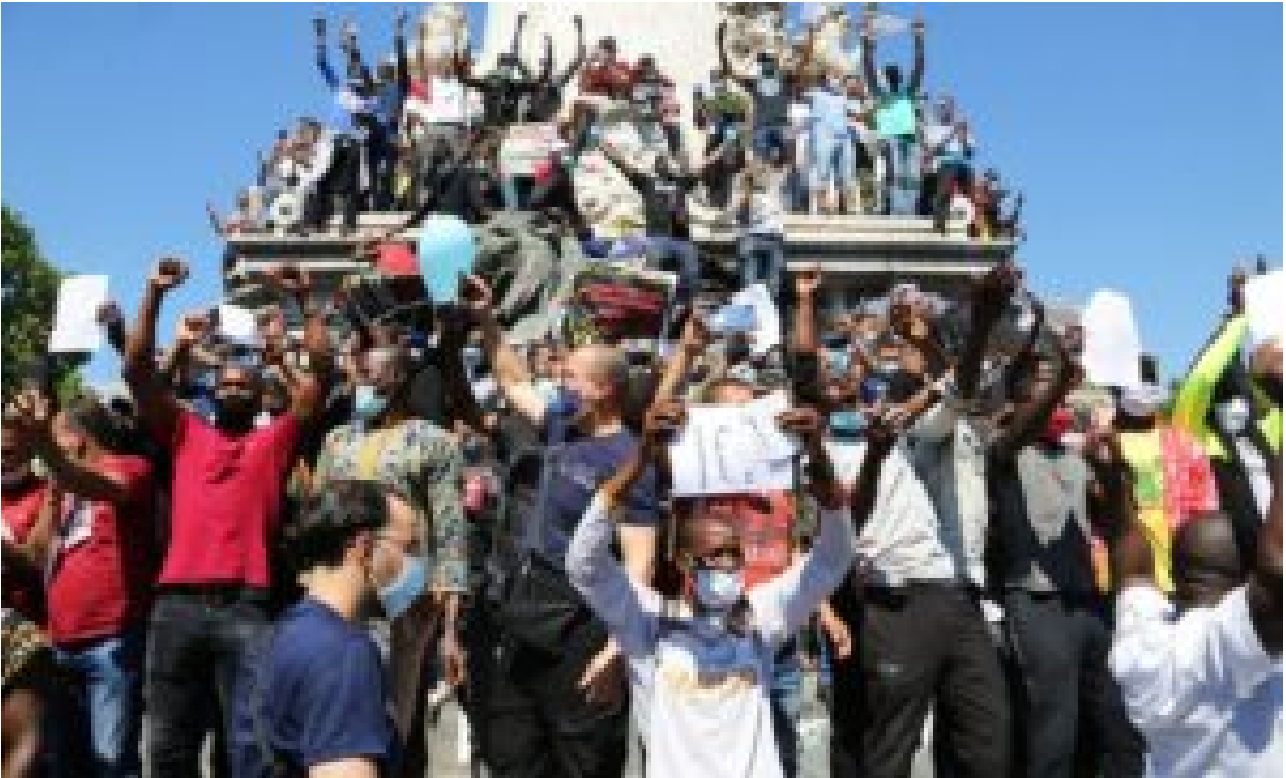
Manifestation de clandestin le 30 mai dernier

Comme il en arrive des centaines de milliers chaque année, il sera de plus en plus difficile aux forces de l'ordre de contrôler des individus un tantinet suspects. A moins de faire rentrer massivement par « discrimination positive » la diversité dans les rangs policiers : ainsi, un Noir ne serait contrôlé que par des policiers noirs, un Maghrébin par des policiers maghrébins et hallal etc.