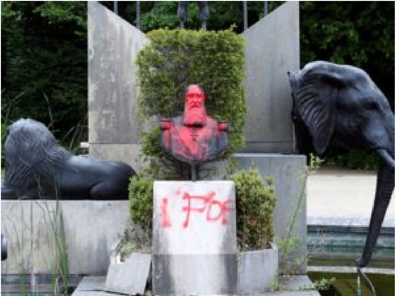
Buste tagué de Léopold II de Belgique