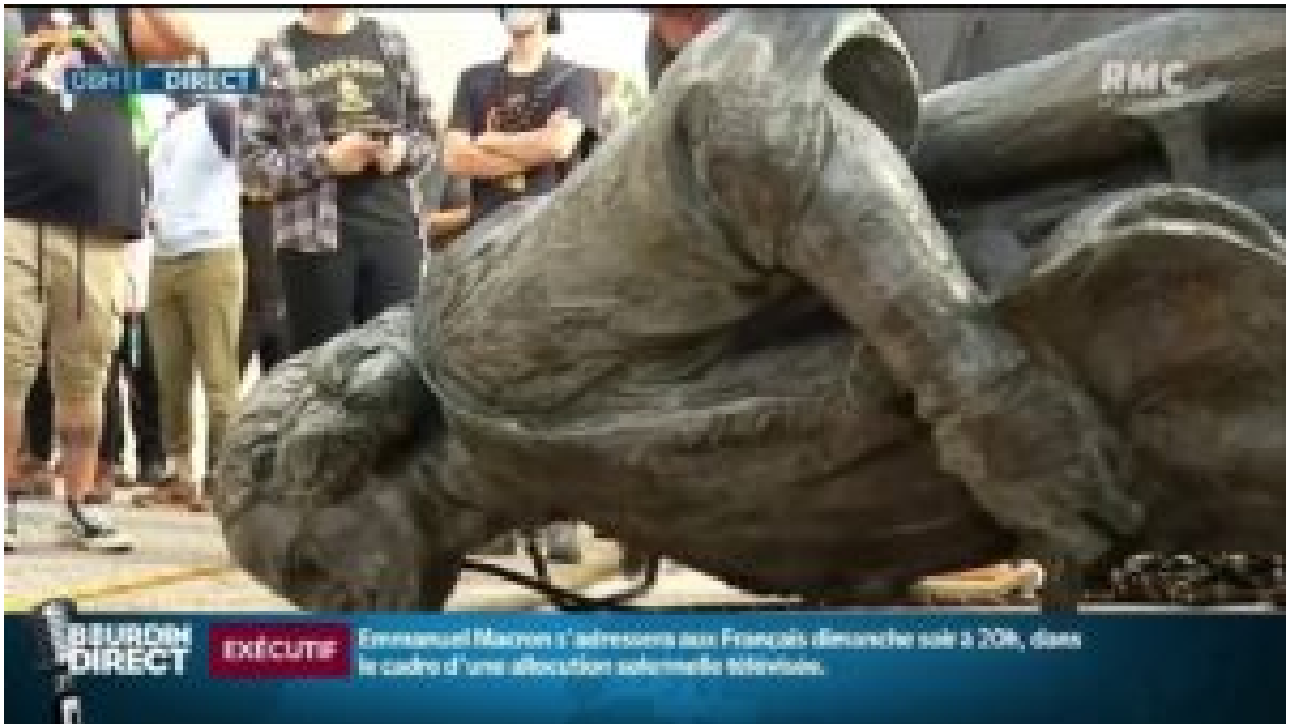
Christophe Colomb face contre terre (« lay face down »)