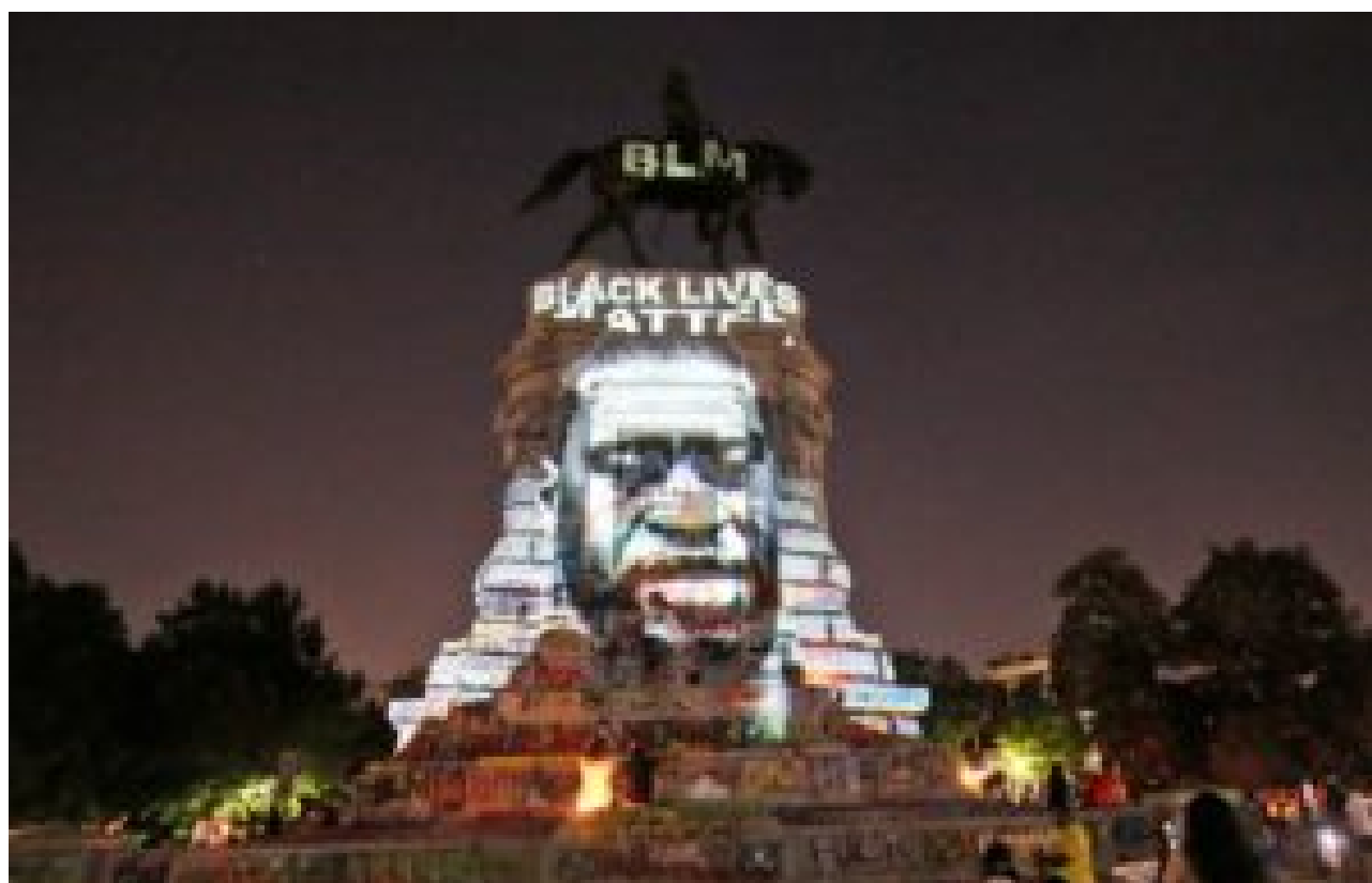
Statue du Général Lee à Richmond, Virginie