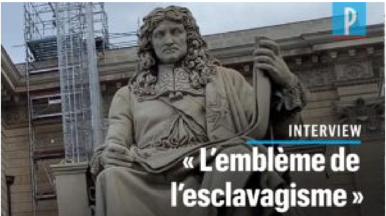
Bientôt le même sort pour la statue de Colbert ?