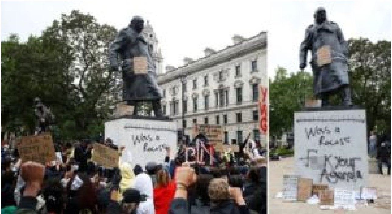
Même Churchill, le sauveur de la nation anglaise face aux nazis !