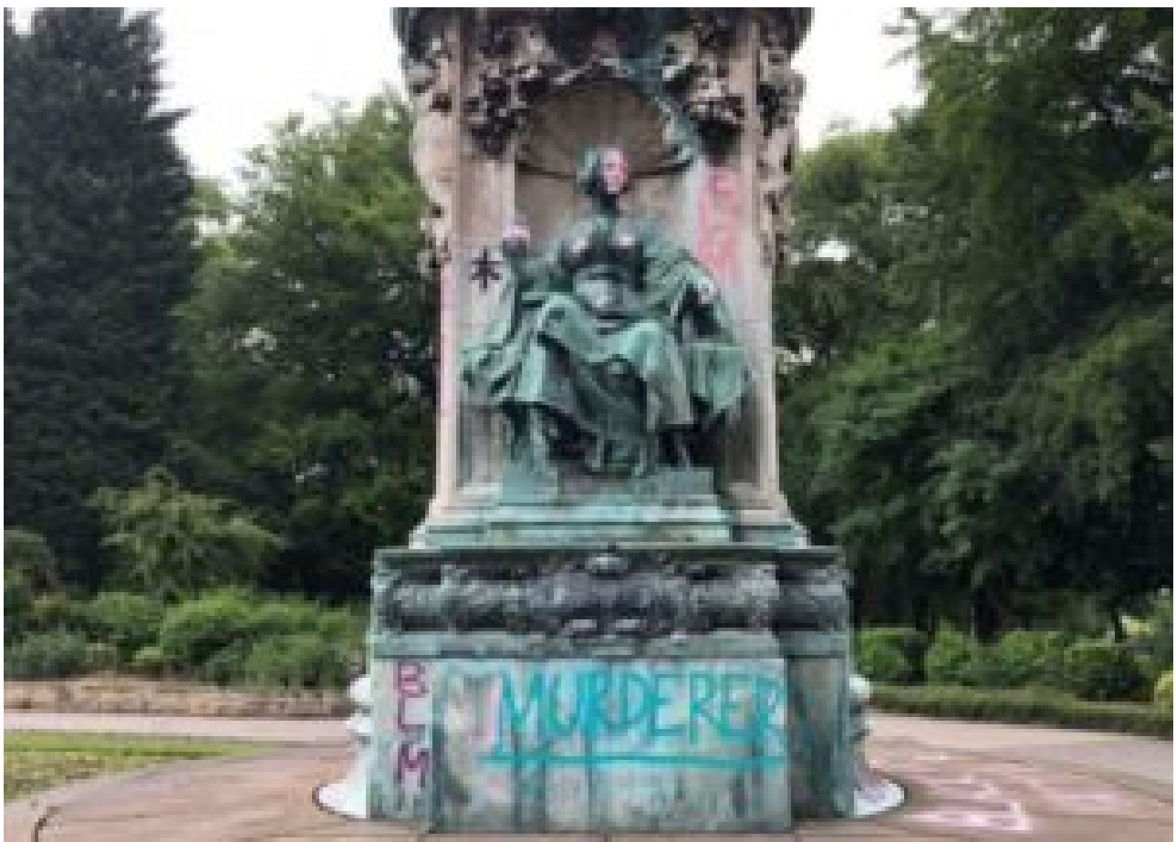
Le monument à la Reine Victoria vandalisé à Leeds (RU)