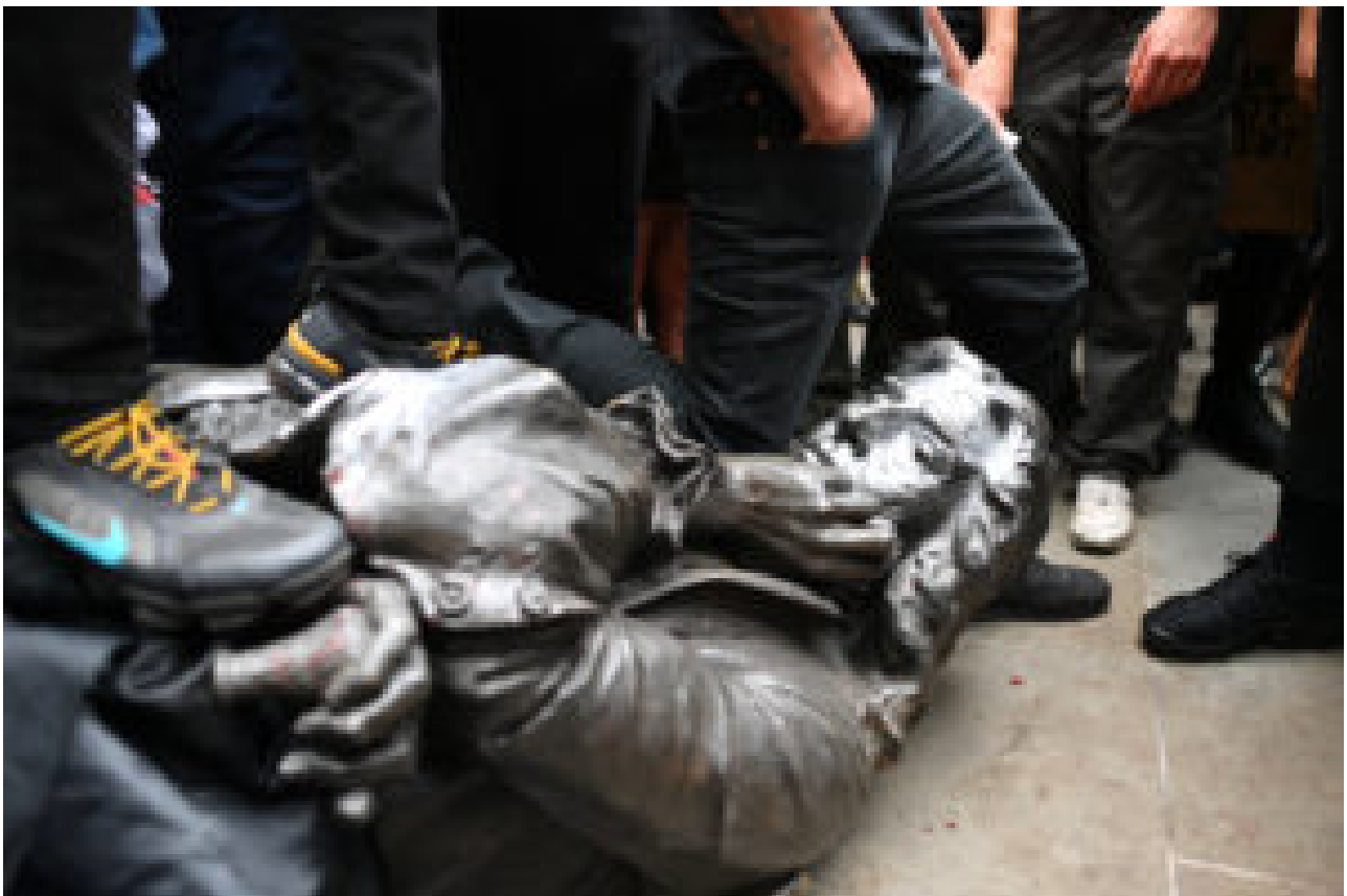
Sur la statue d'Edward Colston à Bristol, Royaume-Uni