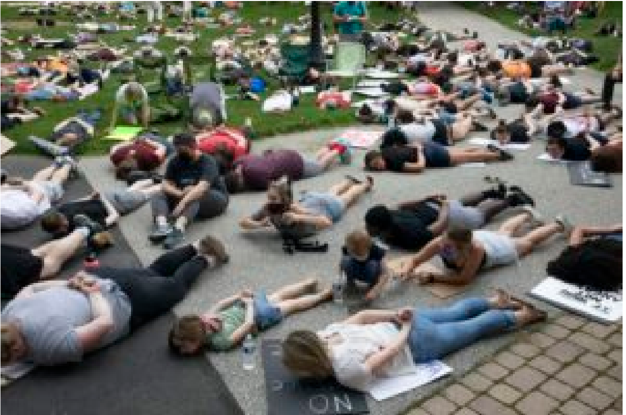
Carlsile, Pennsylvanie