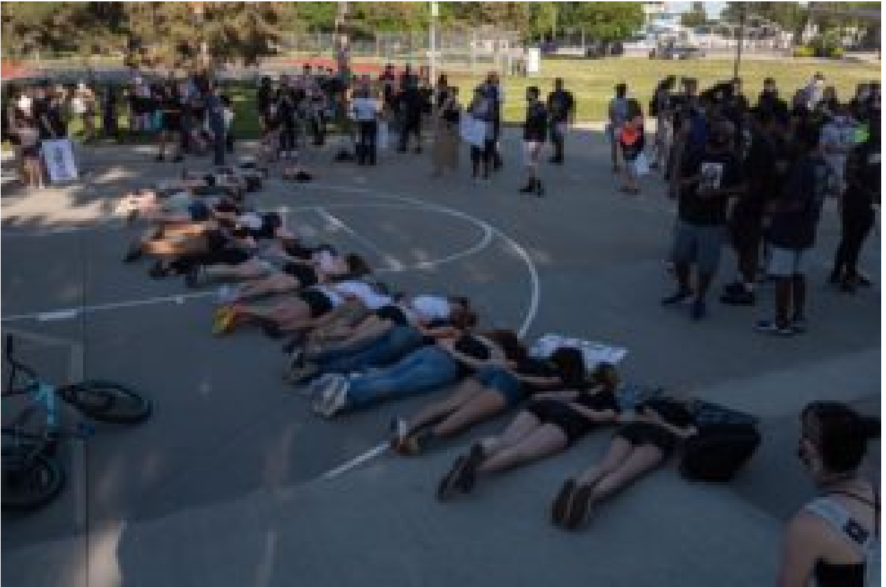
City Park, Manhattan, Kansas