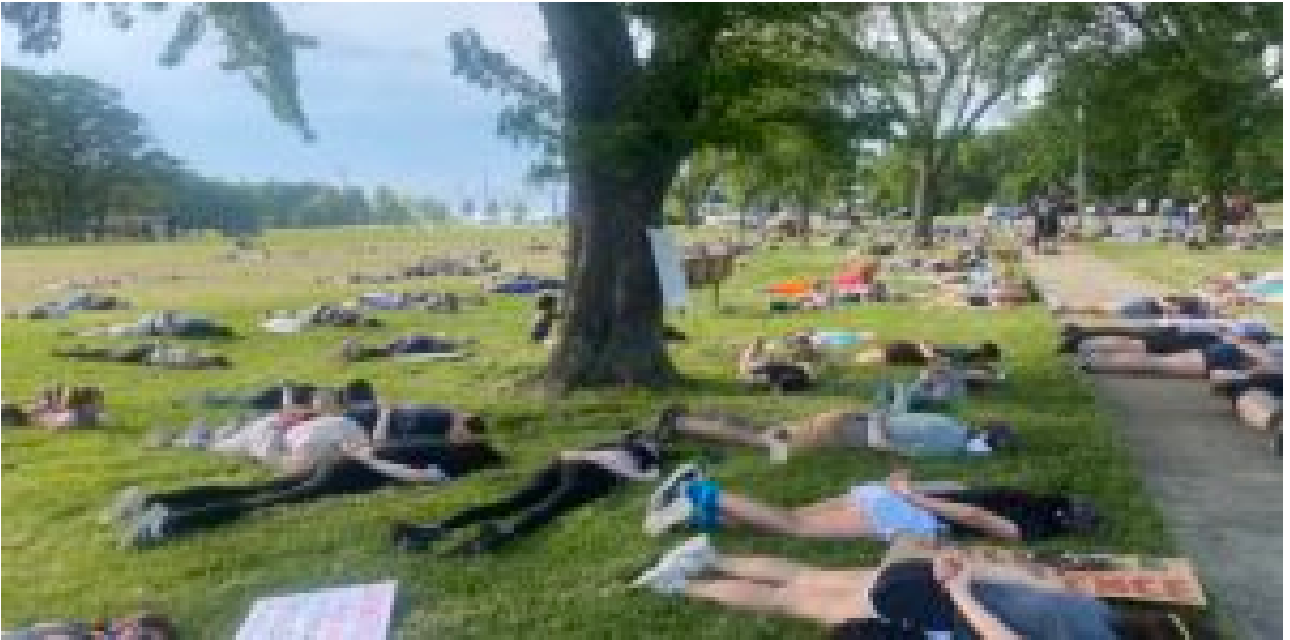
Bay Village, Ohio