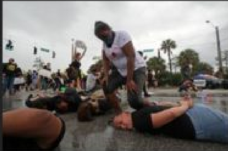
West Palm Beach, Floride