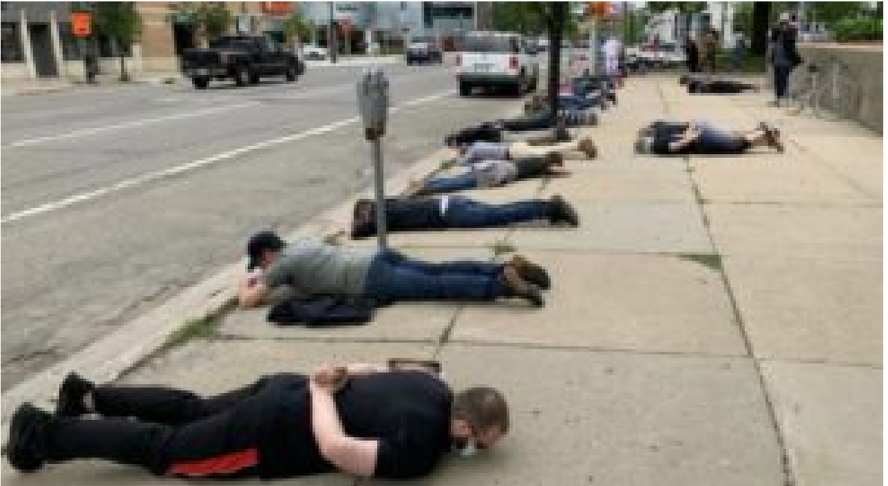
Kalamazoo, Michigan