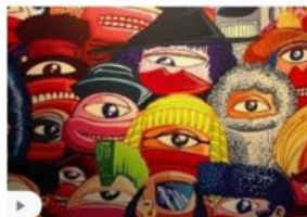
Hervé Di Rosa expose son 'art modeste' ... youtube.com