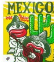
Mexico affiche lithogra... rlddiffusion.com - En stock