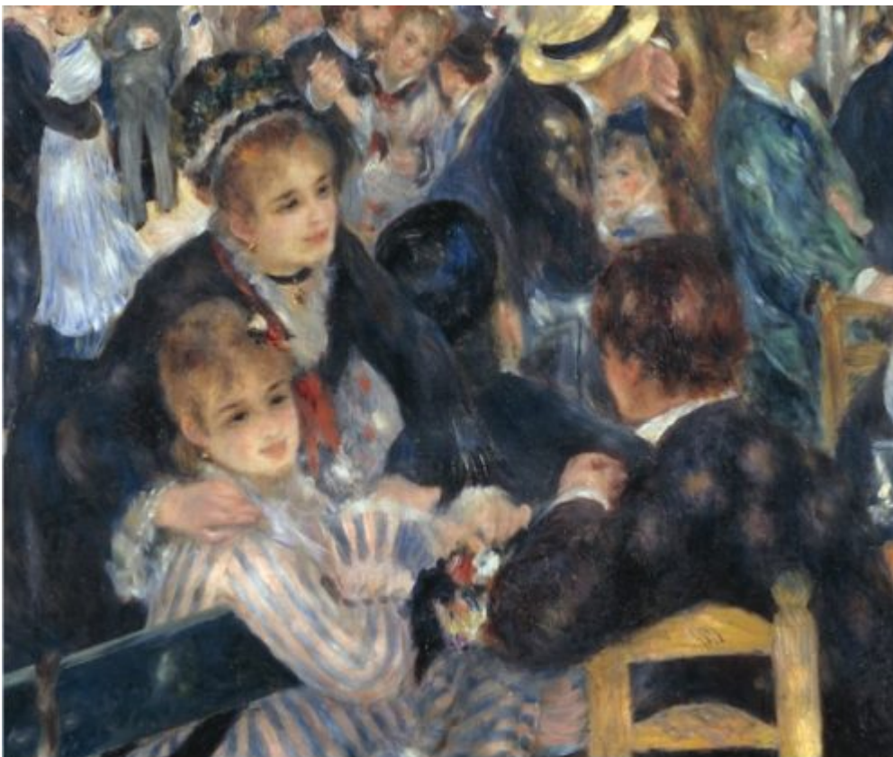
Pierre-Auguste Renoir, «Bal du moulin de la Galette», 1876 (détail)

Renoir = tableaux à brûler pour l'appropriation culturelle éhontée du patronyme « Renoir » qui fait penser à « Noir » et devrait être réservé à cette communauté.