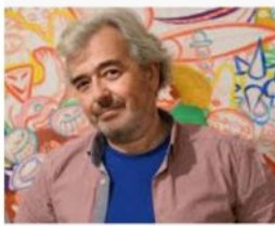
Hervé di Rosa "Ce qui m'intéresse c'... franceculture.fr