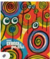
HERVÉ DI ROSA GRAPH... fage-editions.com