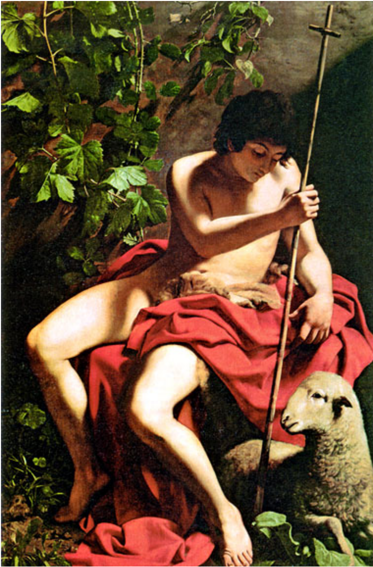
Saint Jean Baptiste du Caravage

Gauguin = tableaux à brûler pour l'image de la Tahitienne.