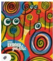
HERVÉ DI ROSA GRAPH... fage-editions.com