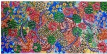
Hervé Di Rosa | Galerie Keza galeriekeza.com