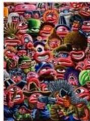
Hervé DI ROSA - Cotatio... i-cac.fr