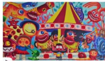
Hervé Di Rosa, figure libre... - YouTube youtube.com