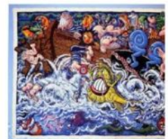
Hervé Di Rosa | Galerie Keza galeriekeza.com