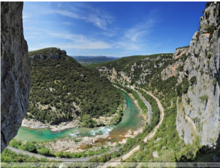
Via ferrata du Thaurac (Saint Bauzille de Putois, Hérault)