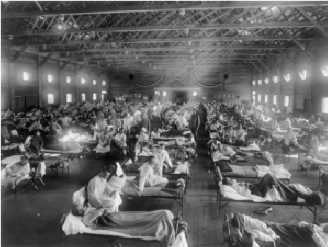
Camp Funston, Kansas: Hôpital d'urgence.