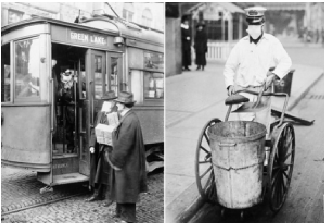
À gauche: Pendant l'épidémie de grippe espagnole, personne