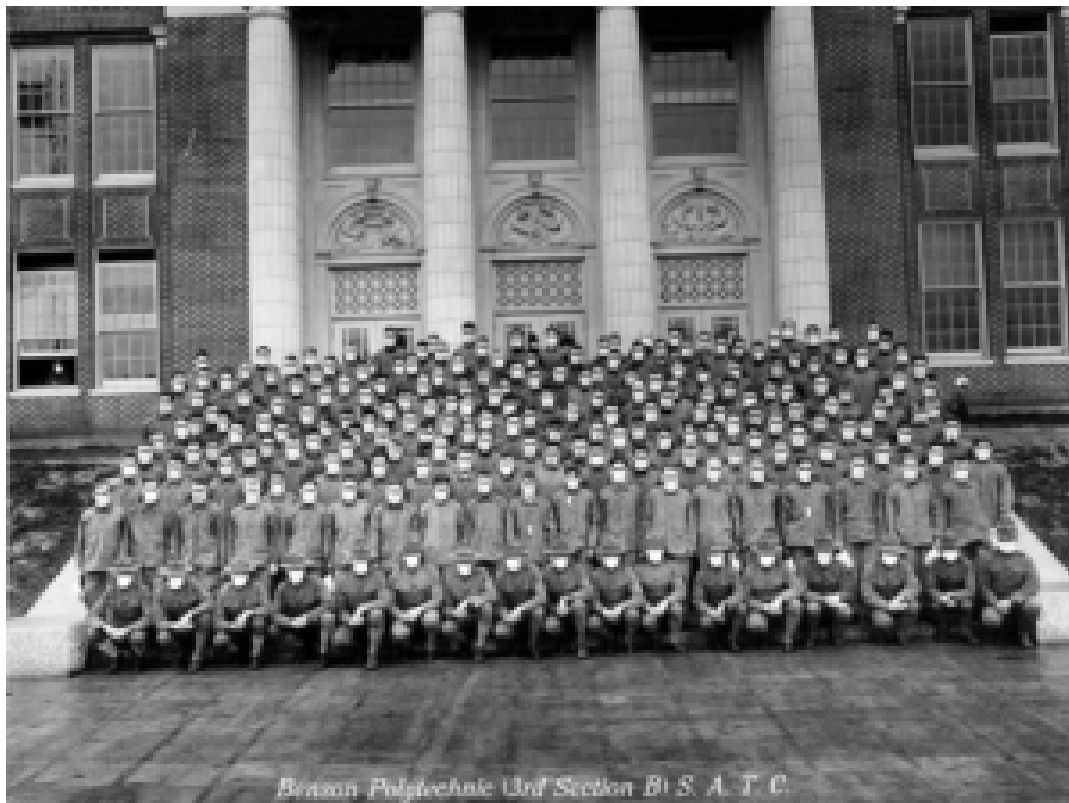
Beaman Polytechnic Unit Section B1 S. A. T. C.

Portland, Oregon : Membres du Student Army Training Corps (académie américaine de formation militaire).