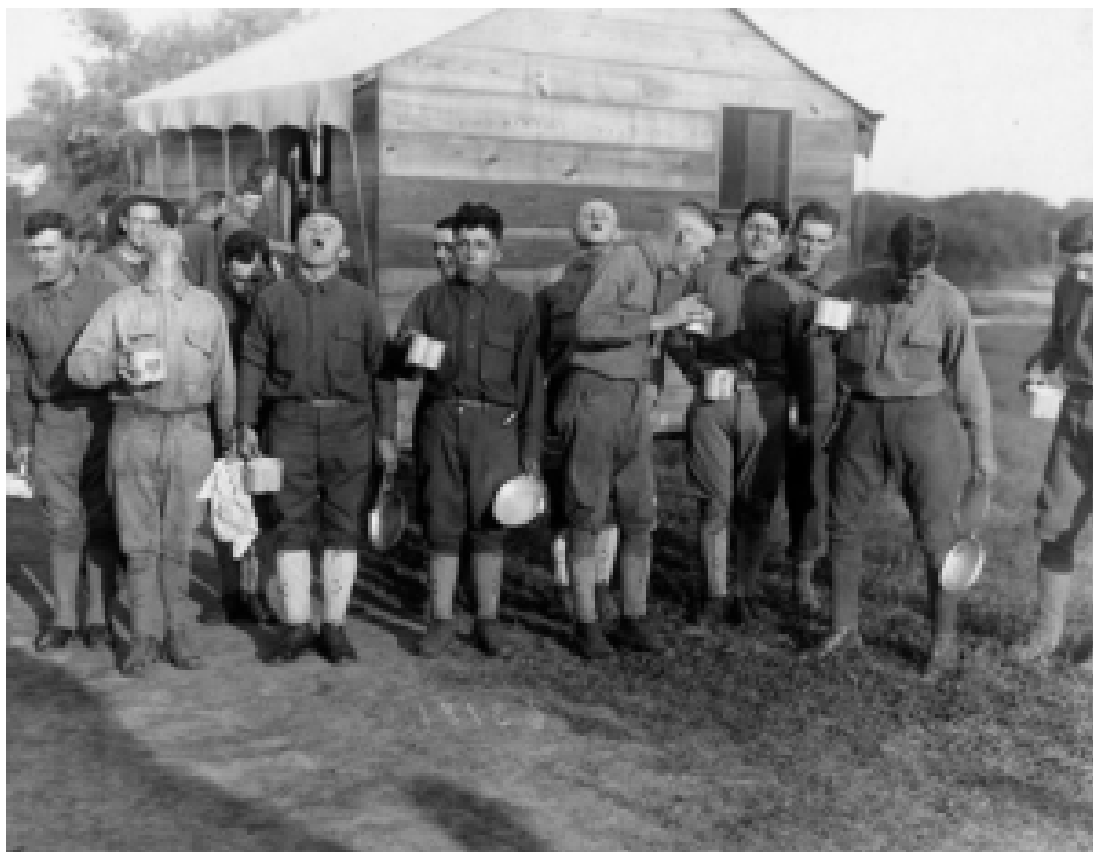
Camp Dix, New Jersey: Des soldats se gargarisent avec de l'eau salée en prévention de la grippe.