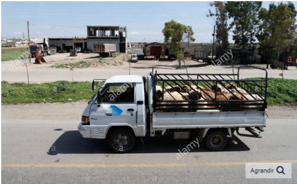
Transport de moutons en Syrie.