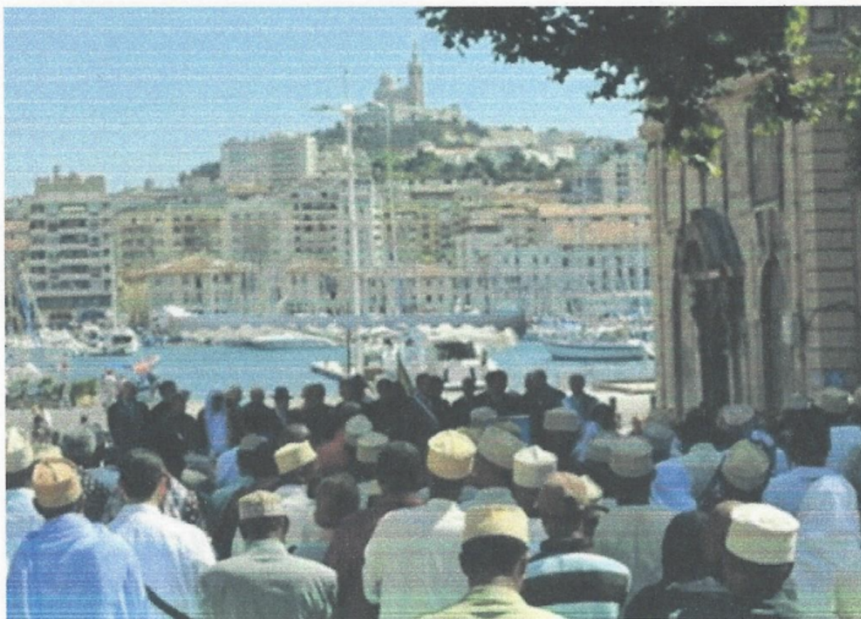
Un rassemblement de Comoriens à Marseille/DR