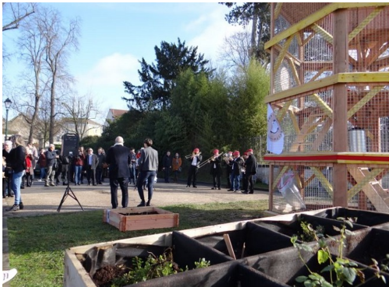
Inauguration du Cocott'arium – au premier plan, une jardinière des Incroyables comestibles