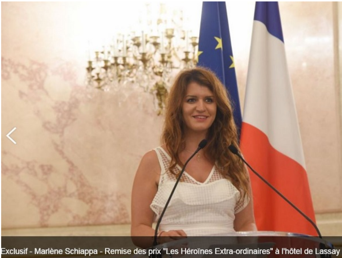
Exclusif - Marlène Schiappa - Remise des prix "Les Héroïnes Extra-ordinaires" à l'hôtel de Lassay à

La France brûle ? Dormez braves gens, le gouvernement travaille d'arrache-pied. Champagne pour Schiappa.