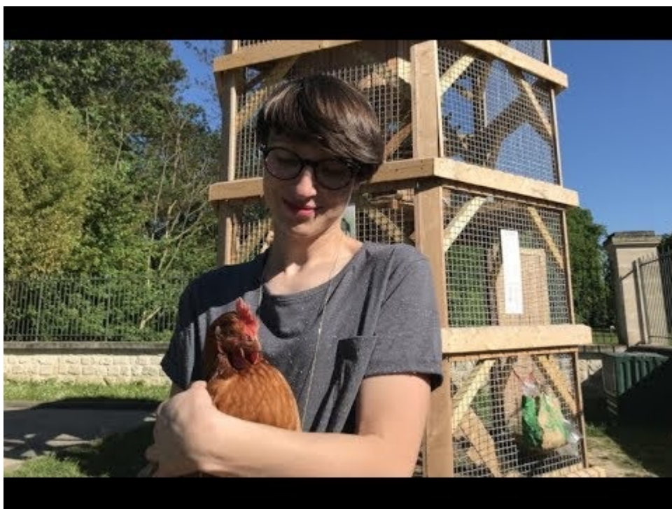
Photo : Paris 18 ème , tourmente médiatique autour d'une invention majeure : le poulailler.

Monique, c'est le nom de la poule. C'est beau.