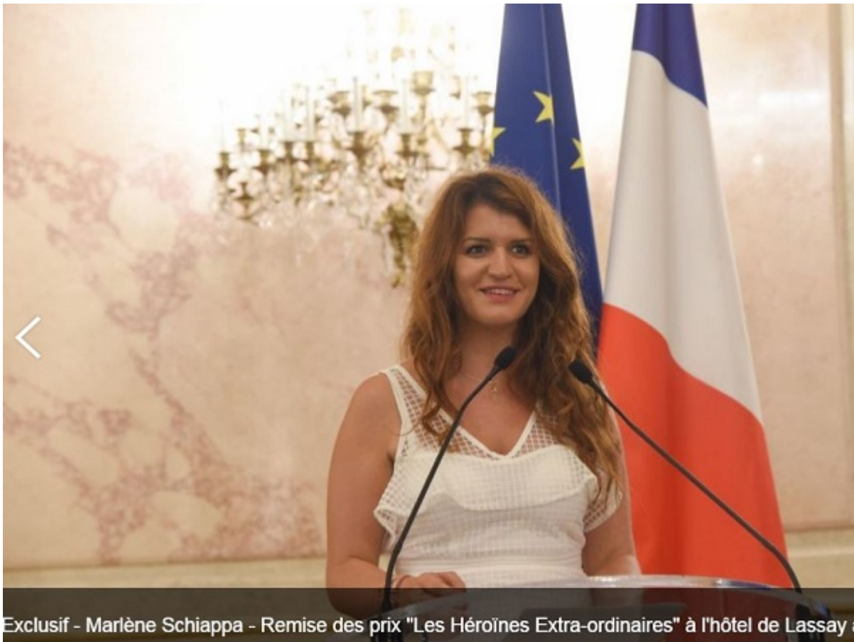
Exclusif - Marlène Schiappa - Remise des prix "Les Héroïnes Extra-ordinaires" à l'hôtel de Lassay à

La France brûle ? Dormez braves gens, le gouvernement travaille d'arrache-pied. Champagne pour Schiappa.