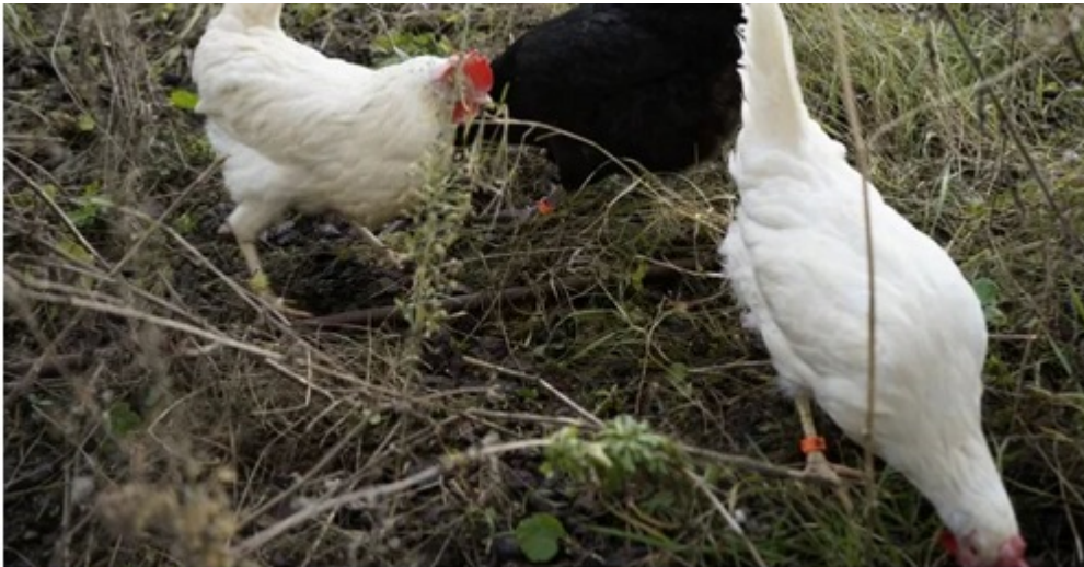
Poules de l'immeuble Nord Express

Paris 18 ème : Salima, une salariée qui pose à côté de la découverte.