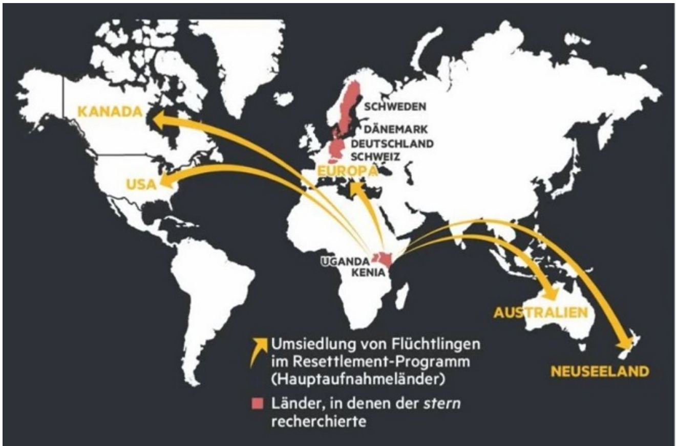
Schéma ci-dessus « De l'Afrique vers le monde occidental » :

En Afrique de l'Est, l'Ouganda et le Kenya sont les principales destinations des réfugiés.