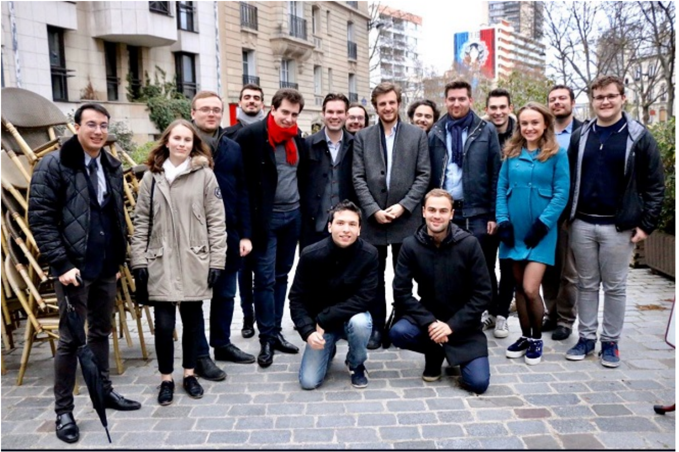
Equipe de jeunes candidats en formation à Paris