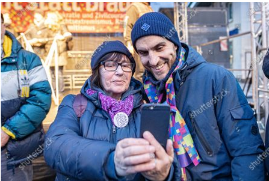
Ci-dessus avec une militante antifa.