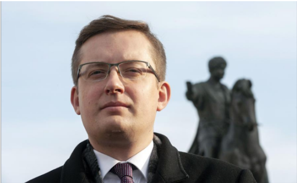
Robert Winnicki / Newspix / GRZEGORZ KRZYZEWSKIFOTONEWS

written by Julien Martel | 23 décembre 2019