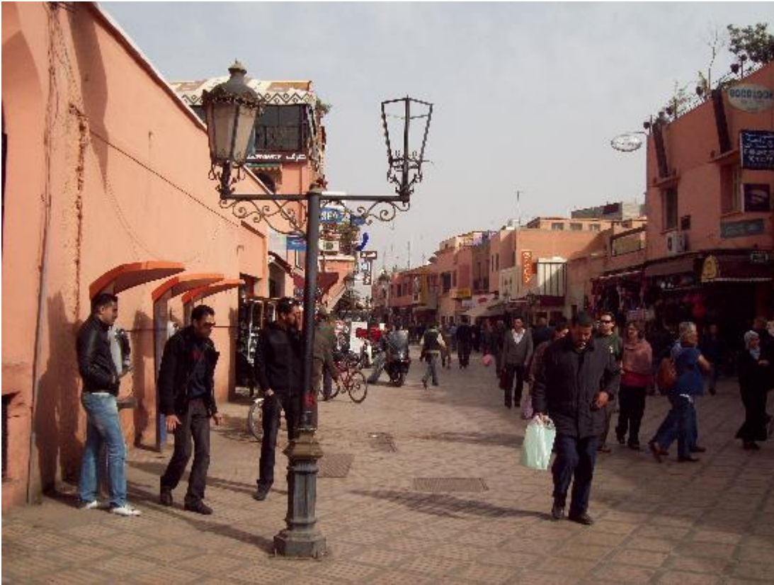
Rue du Prince