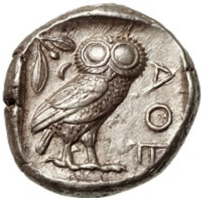
Pièce en argent –Grèce – Athènes -Tétradrachme, – 454-404

Dotée d'une tête caractéristique et d'un regard fixe, la chouette évoque par son immobilité silencieuse la sagesse, par ses mœurs nocturnes et son calme la solitude (celle du misanthrope), par son cri inquiétant des mauvais présages.