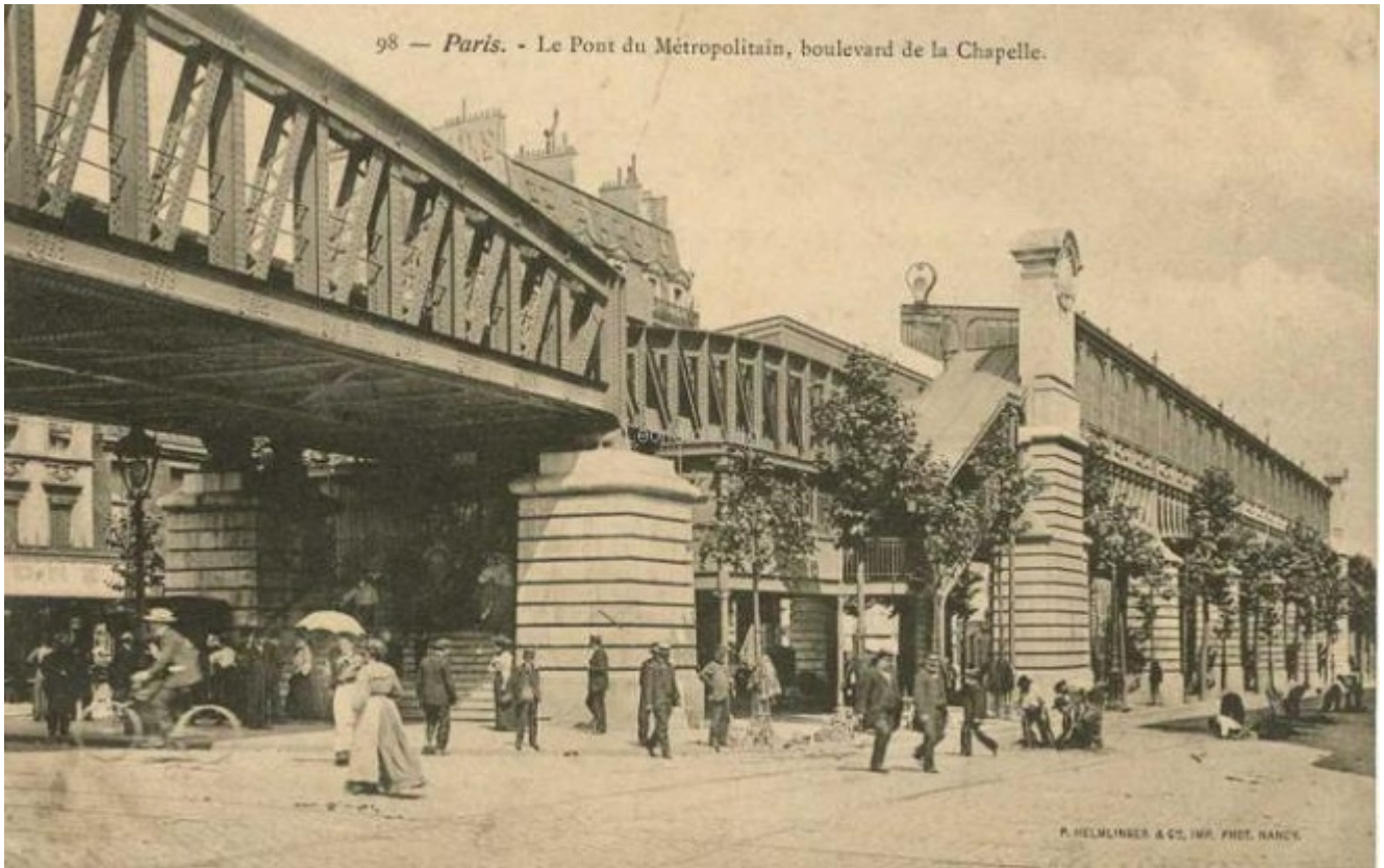
98 — Paris. — Le Pont du Métropolitain, boulevard de la Chapelle.