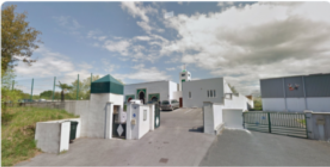
Attaque de la mosquée de Bayonne: un ex-candidat FN arrêté

L'islamophobie est meurtrière : deux hommes ont été blessés ce lundi dans une attaque à main armée de la mosquée de Bayonne. L'auteur présumé des faits a été interpellé : il s'agit d'un ex-candidat FN aficionado d'Éric Zemmour. @AnttonRouget @Mediapart