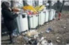
Les poubelles de bord de mer. Plus de 50 % des Français se disent concernés par la lutte contre le gaspillage alimentaire selon une enquête de l'Observatoire de la vie quotidienne pour la Dépêche. Reste à mettre en accord les poisons avec les arêtes. pages 2 et 3

CONSOMMATION En finir avec le grand gaspillage