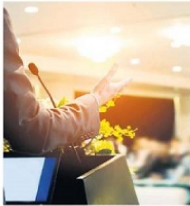
L'Eglise Universelle du Royaume de Dieu à ses fidèles à Toulouse.

Certains Toulousains s'inquiètent de la présence dans leur ville des Eglises évangéliques, et du prosélytisme de leurs membres. Parmi elles, le Centre d'accueil universel qui dispense des promesses de guérison miraculeuse. page 10 et 11