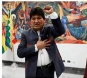
Evo Morales, à La Paz, le 24 octobre.

C'EST LA FIN D'UN RIPOSTE de quatre jours, devant laquelle le populisme bolivien est resté muet face aux résultats de l'élection présidentielle, alors que le dialogue des dirigeants vient à peine de commencer depuis dimanche. Le président sortant, Evo Morales, a été déclaré vain-