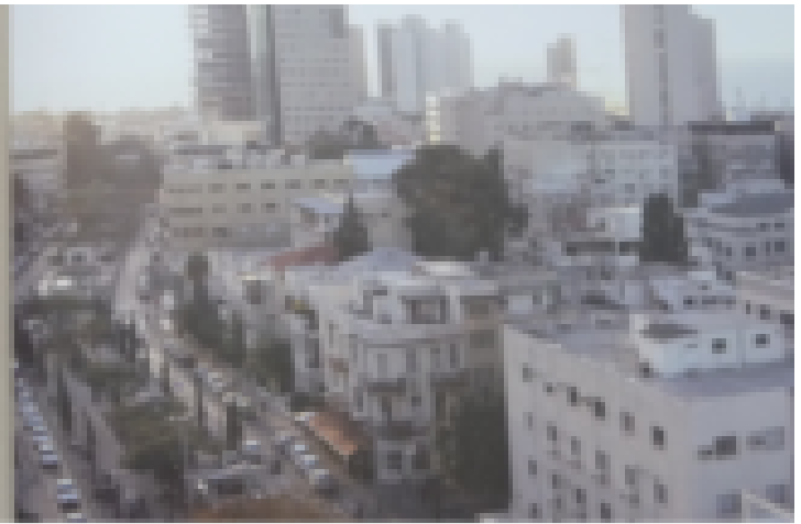
TEL AVIV XXIÈME SIÈCLE