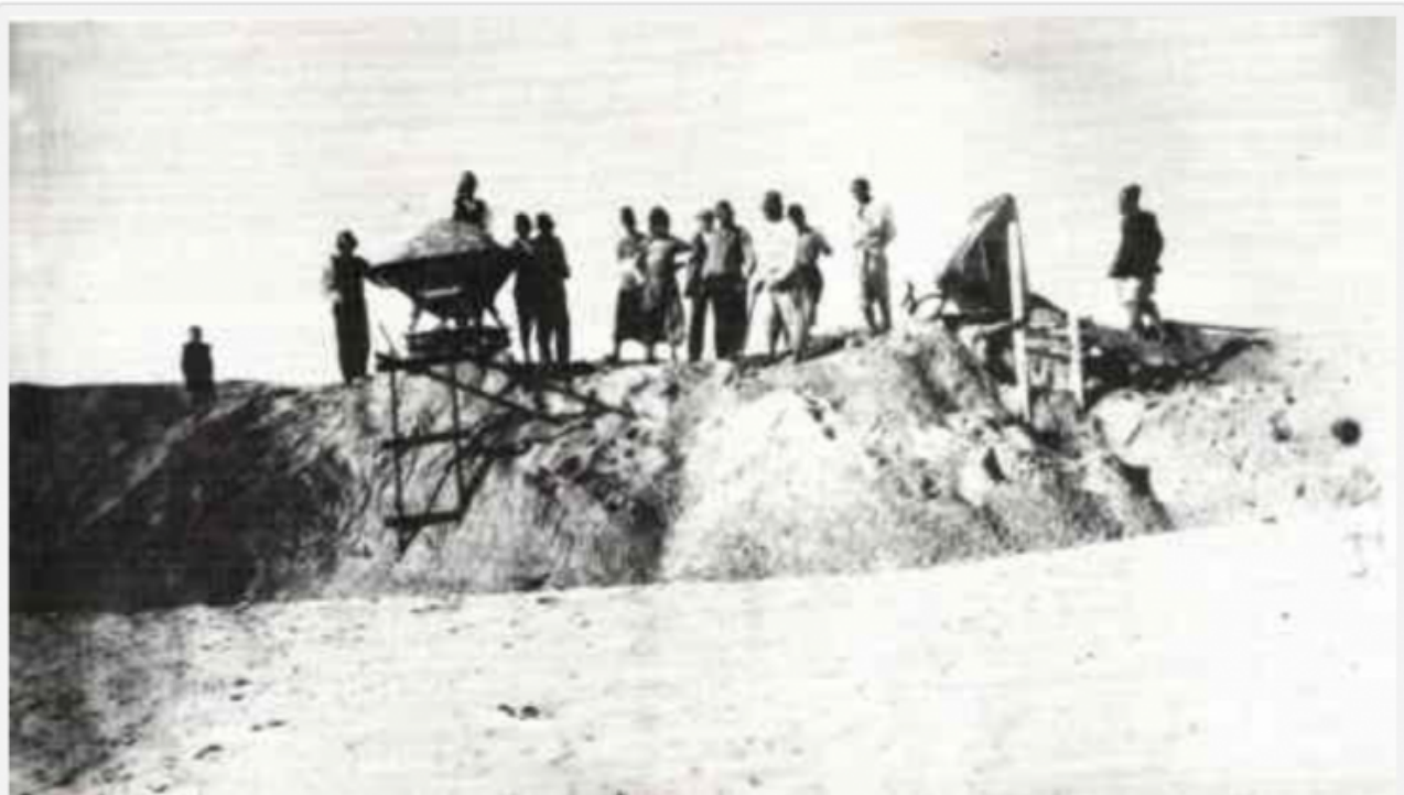
1910 Harassants travaux de terrassement dans les dunes de sable. - TEL AVIV