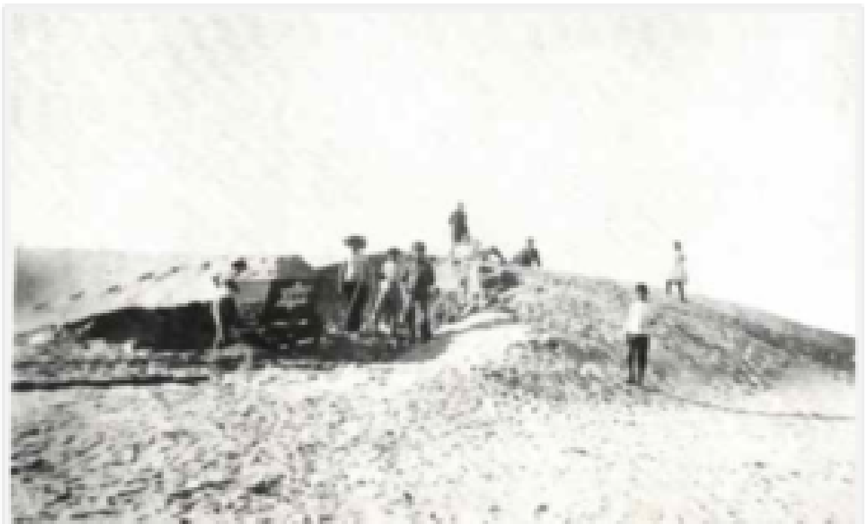
1909 Travaux de terrassement de la future rue Allenby - TEL A&TV