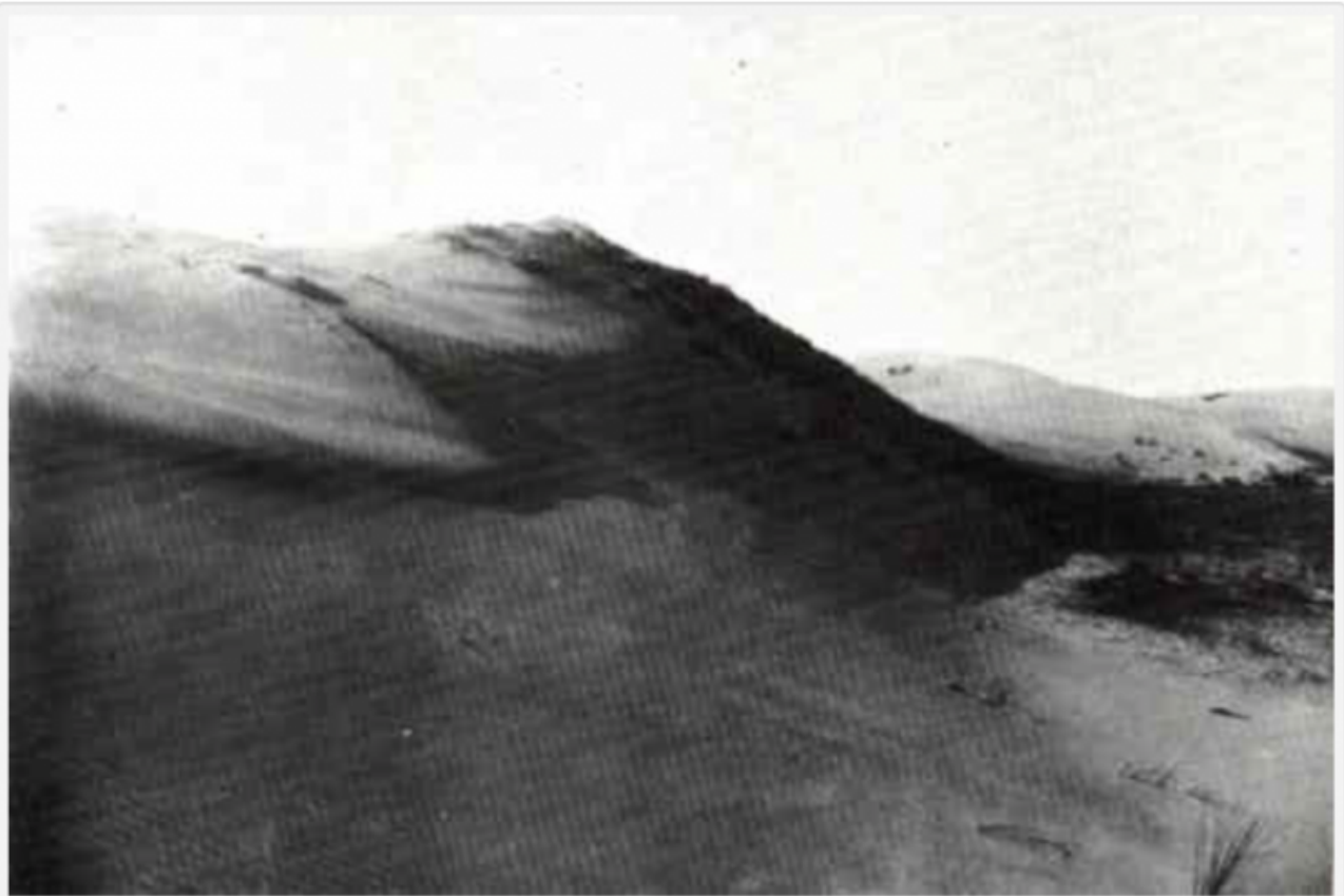
1909 Dunes de sable où la construction de Tel Aviv va être entreprise - TEL AVIV