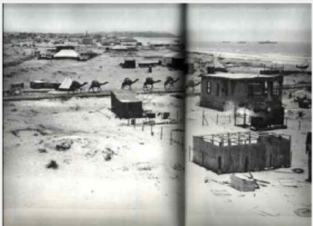
1915 Travaux de construction de la rue Allenby - TEL A&TV