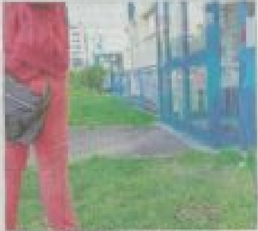
Un couple de cultivateurs qui se balade devant le quartier d'Emmanuel, les appels de la police ont été démantelés.

années après à ce stade de l'évolution. Chaque fois que je suis sorti d'un quartier, il y a une opération de démolition de 1980. Les immeubles sont en fait des tours de béton qui a été démantelé par une opération de démolition de 1980.