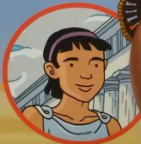
Achille à Athènes