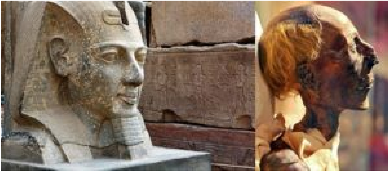
Ramsès II (1279 à 1213 av. J.-C.)

Moins impressionnantes que leurs cousines de Gizeh, les pyramides nubiennes (dont celles de Méroé), au Soudan, n'en sont pas moins surprenantes. Traitant du royaume de Koush, il aurait été compréhensible que Bayard Presse choisisse alors des monarques noirs pour illustrer ce thème.