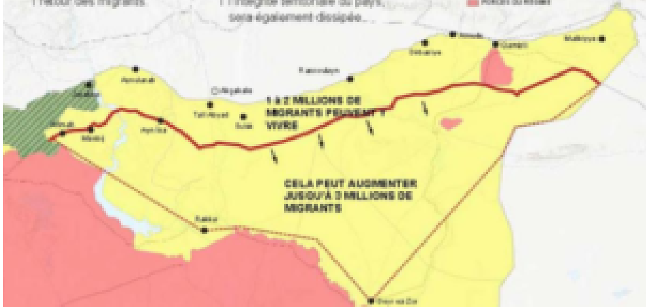
Cartographie : TRT.net (site pro-turc)