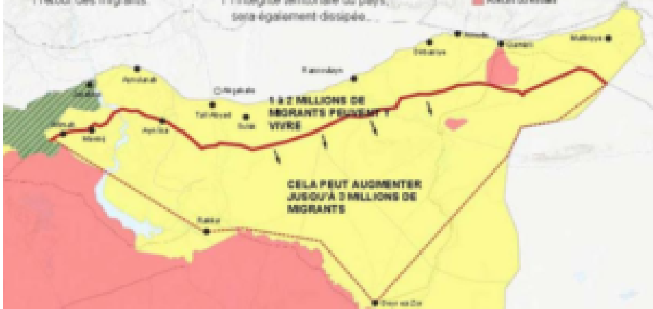
Cartographie : TRT.net (site pro-turc)