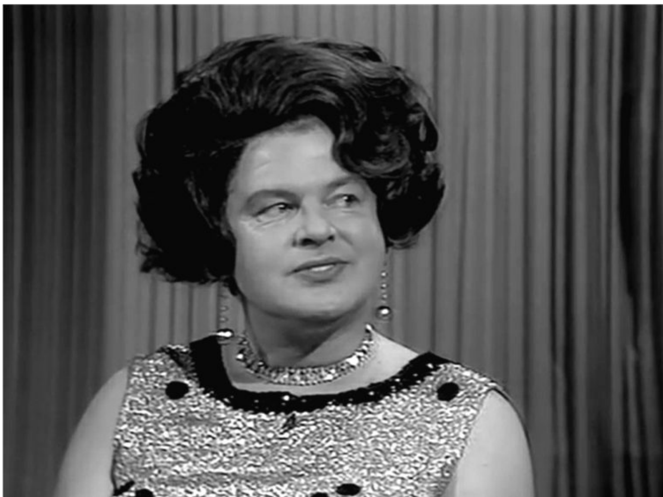
Illustration : Benny Hill ou l'humour beauf, sexiste, misogynne, raciste, xénophobe, grossophobe, gérontophobe ?

écrit par François des Groux | 25 septembre 2019