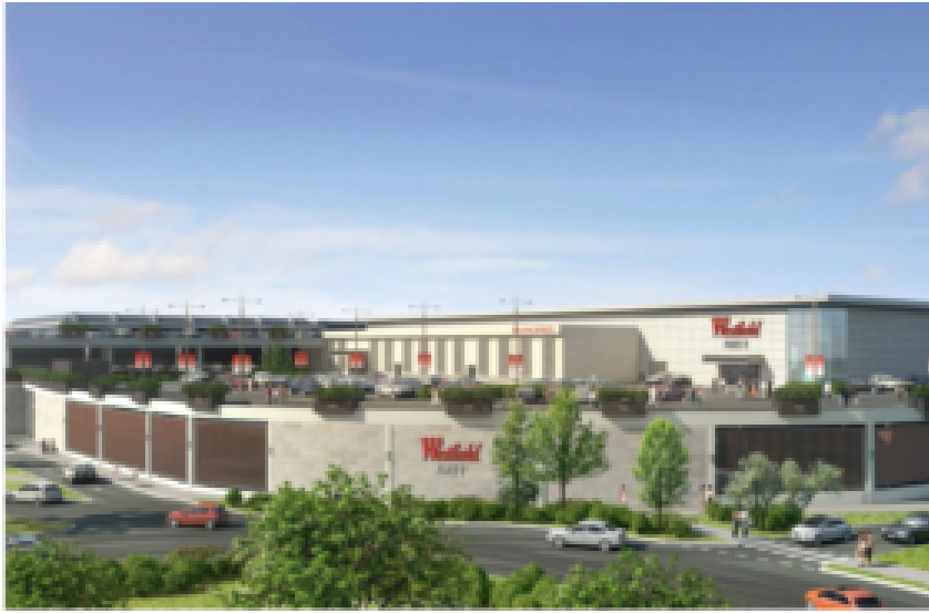
En France, le centre situé au Chesnay (78) sera le quatrième à être baptisé sous nouvelle bannière, Westfield Parly 2, le 18 septembre 2019.

Le déploiement de la marque Westfield en Europe continentale avait été annoncé lors de l'acquisition de Westfield par Unibail-Rodamco en 2018 pour former Unibail-Rodamco-Westfield, « le premier créateur et opérateur global de centres de shopping de destination ». Le groupe révèle aujourd'hui le nom et le calendrier des dix premiers centres de shopping qui bénéficieront de la marque. Tout démarre en septembre 2019, hormis deux autres projets de développement les prochaines années.