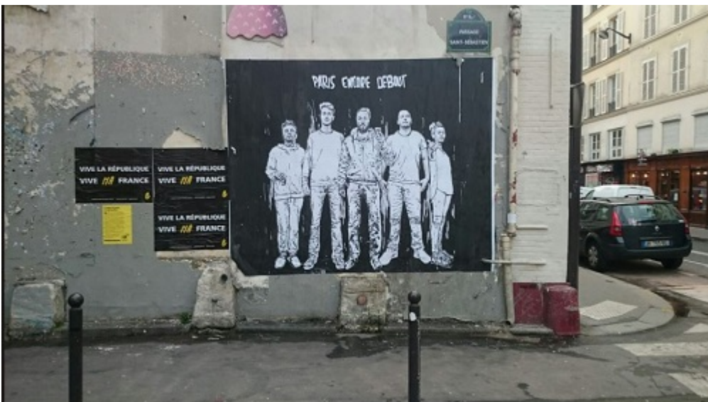
SOS RACISME ( LA PETITE MAIN JAUNE )