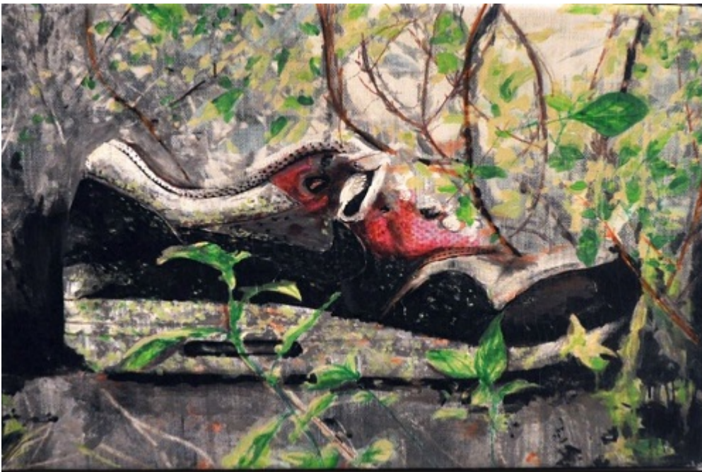
DECORATIF DANS LA RUE...