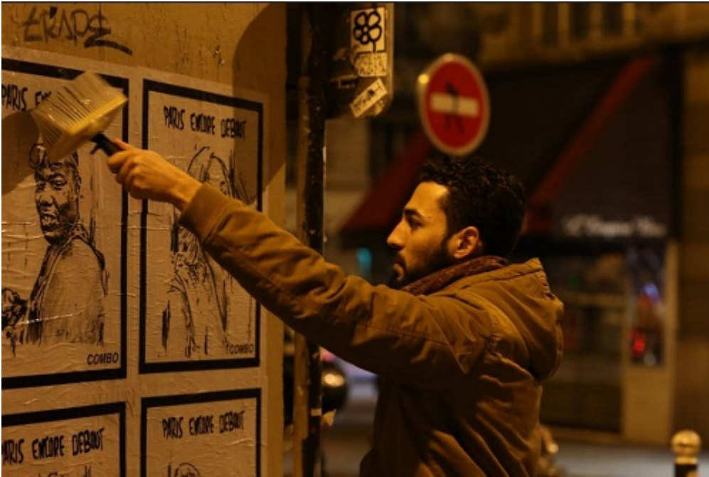
L'ARTISTE EN ACTION