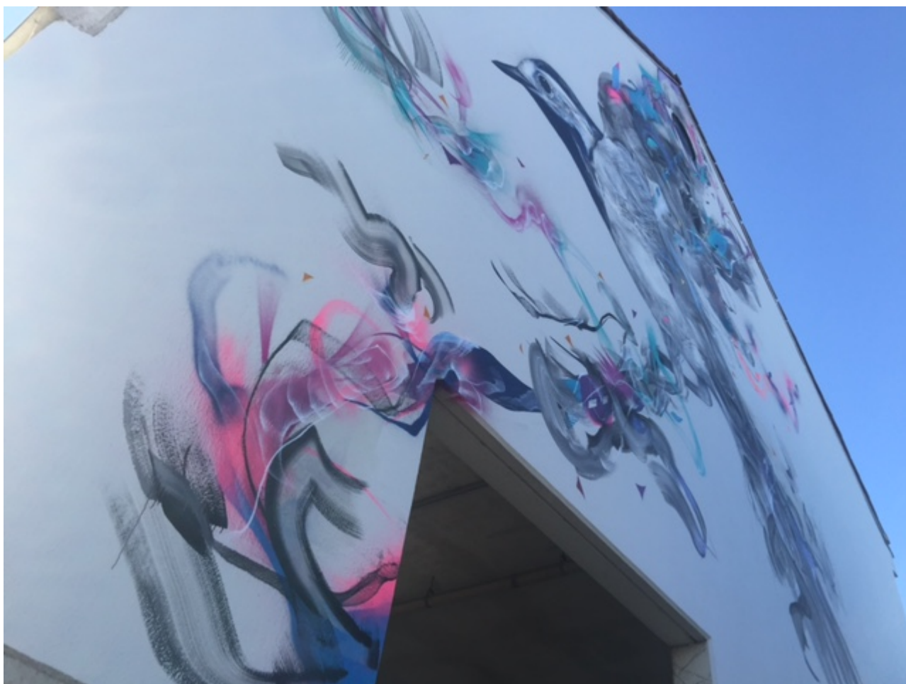
Photo : COMBO, un "artiste" subventionné qui se targue de faire la promotion de la laïcité...en placardant des signes religieux sur nos murs !

écrit par Jules Ferry | 20 septembre 2019