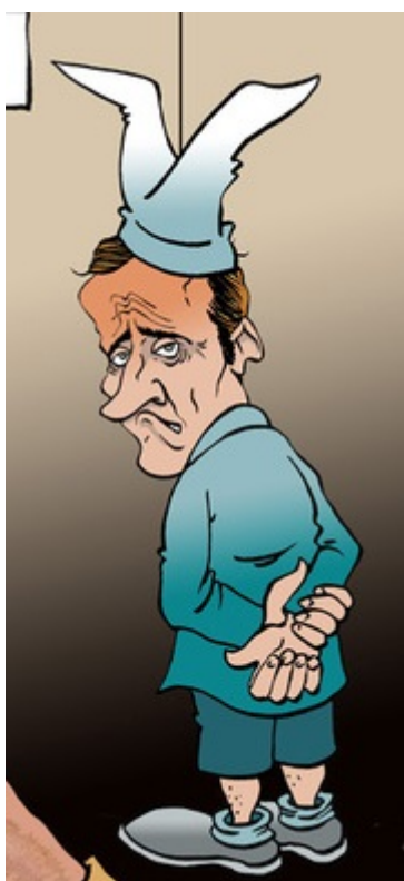
Illustration : une école républicaine d'il y a bien longtemps...quand la République avait l'ambition de s'occuper de TOUS ses enfants...

écrit par Jules Ferry | 10 septembre 2019