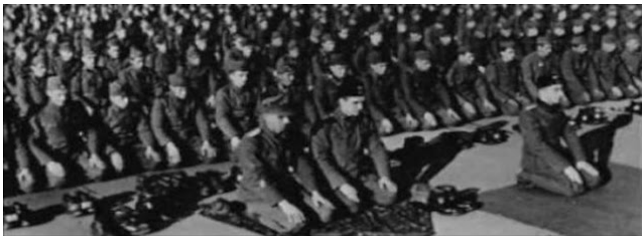
soldats Waffen SS musulmans faisant la prière