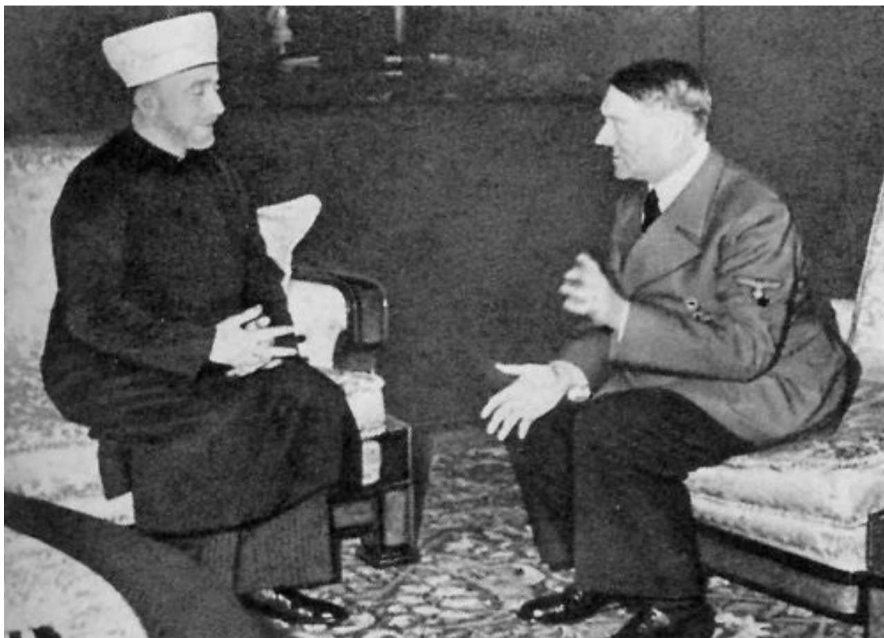
Hitler et le grand mufti de Jérusalem, inspirateur de l'extermination des Juifs.