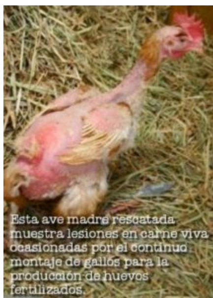
Esta ave madre rescatada muestra lesiones en carne viva ocasionadas por el continuo montaje de gallos para la producción de huevos fertilizados.

La première vidéo est en début d'article. Elle est suivie de la photo ci-dessous.