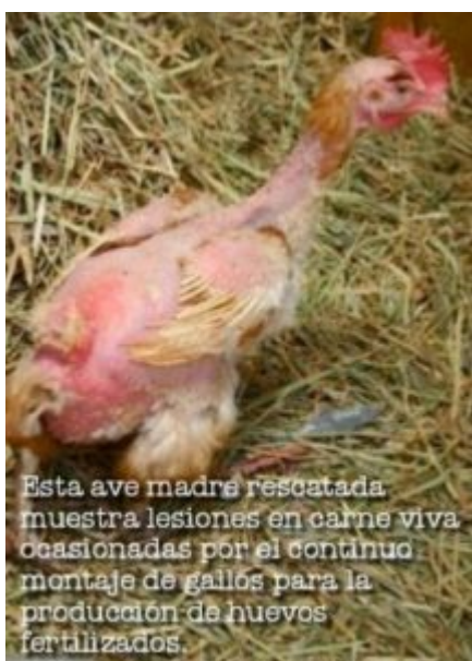
Esta ave madre rescatada muestra lesiones en carne viva ocasionadas por el continuo montaje de gallos para la producción de huevos fertilizados.

La première vidéo est en début d'article. Elle est suivie de la photo ci-dessous.