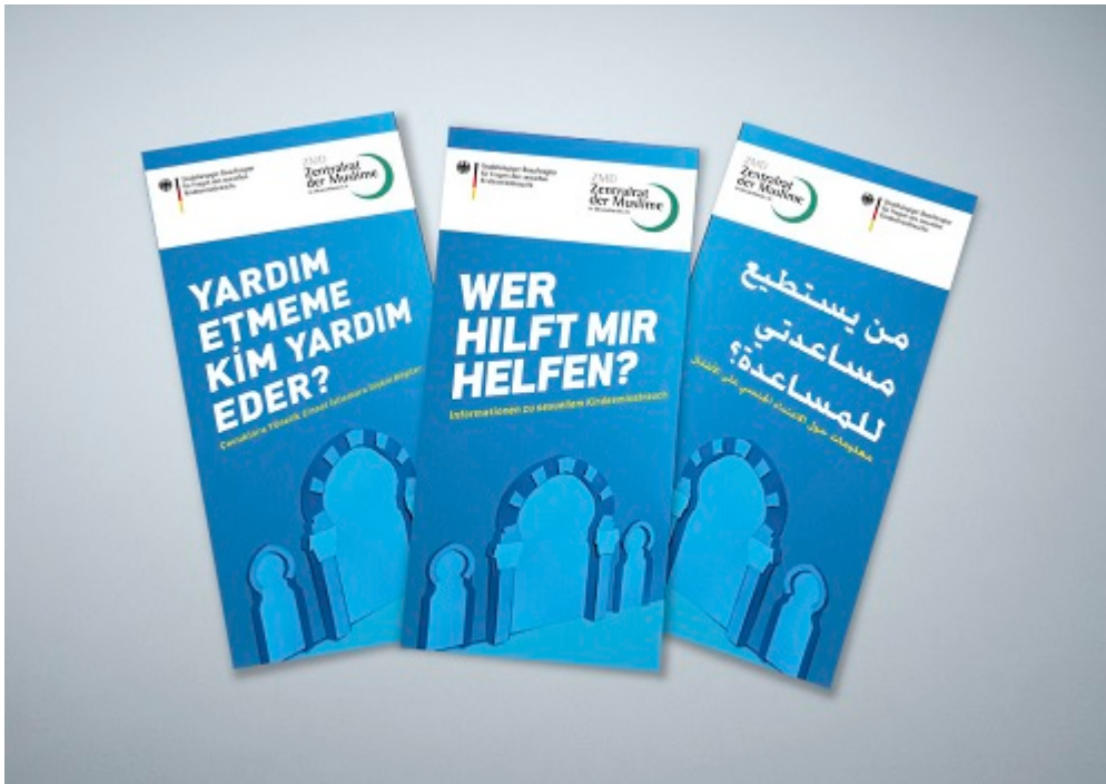
Photo : des dépliants, édités par les services de protection de l'enfance, pour briser le silence.

L 'opération d'information des services de protection de l'enfance se présente ainsi :