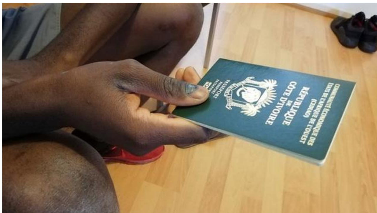
Adama Fofana, passeport en main dans son studio à Orléans.

À la place de son hébergement actuel, un studio dans le centre-ville d'Orléans, le jeune ivoirien touchera seulement l'allocation jeune insertion Loiret, une aide de 450 euros et les autres aides comme l'AME ou la gratuité des transports. Insuffisant pour couvrir tous ses besoins.