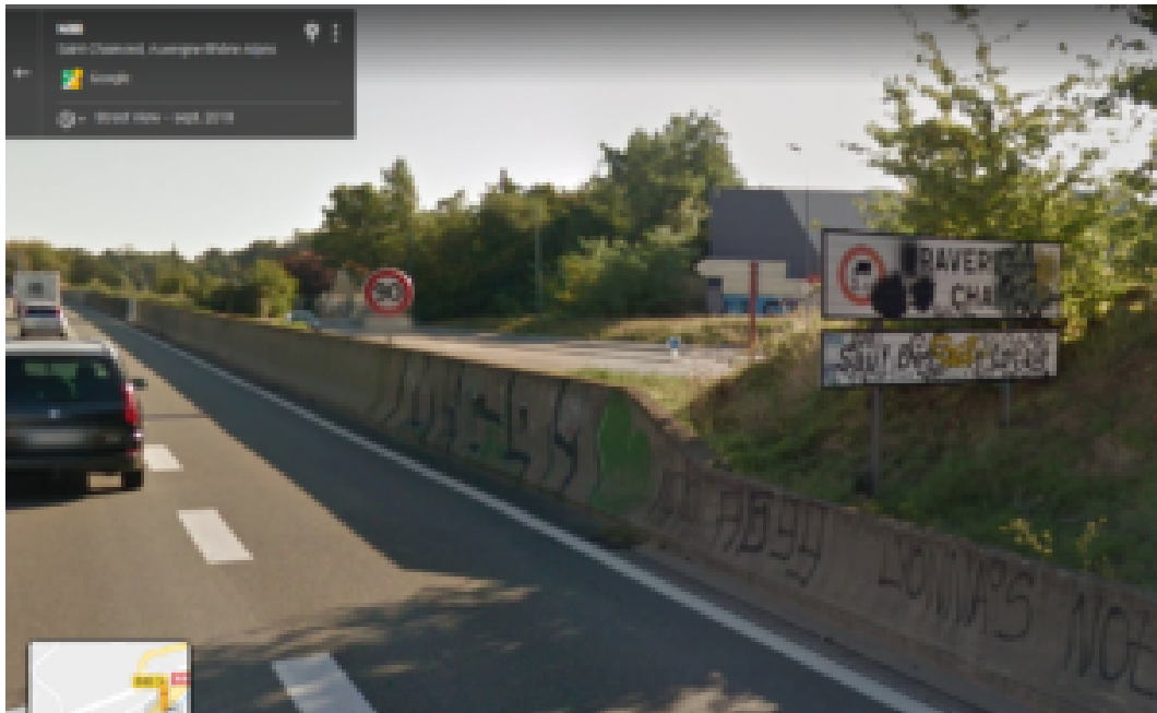
Des panneaux illisibles