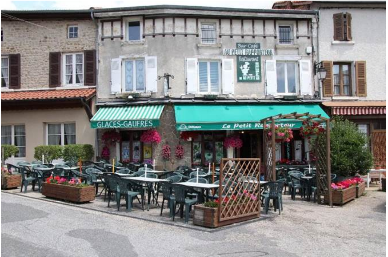
Yzeron: Madame Paradis est encore parmi nous!