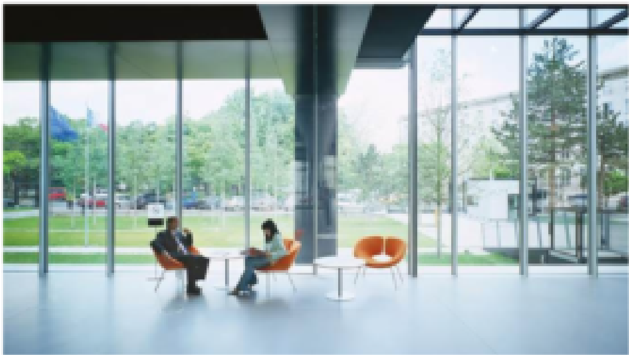
Ambassade de France à Varsovie, intérieur vier symbolisant l'ouverture au monde