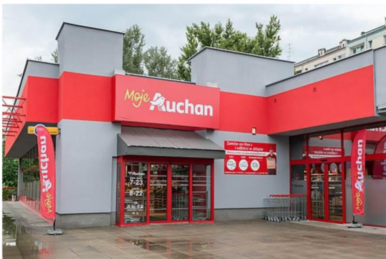
Magasin de proximité « Mon Auchan »

Illustration : marche patriotique de l'Indépendance à Varsovie, 2018