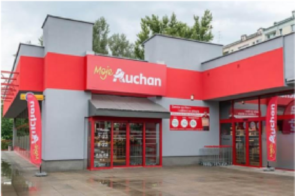
Magasin de proximité « Mon Auchan »