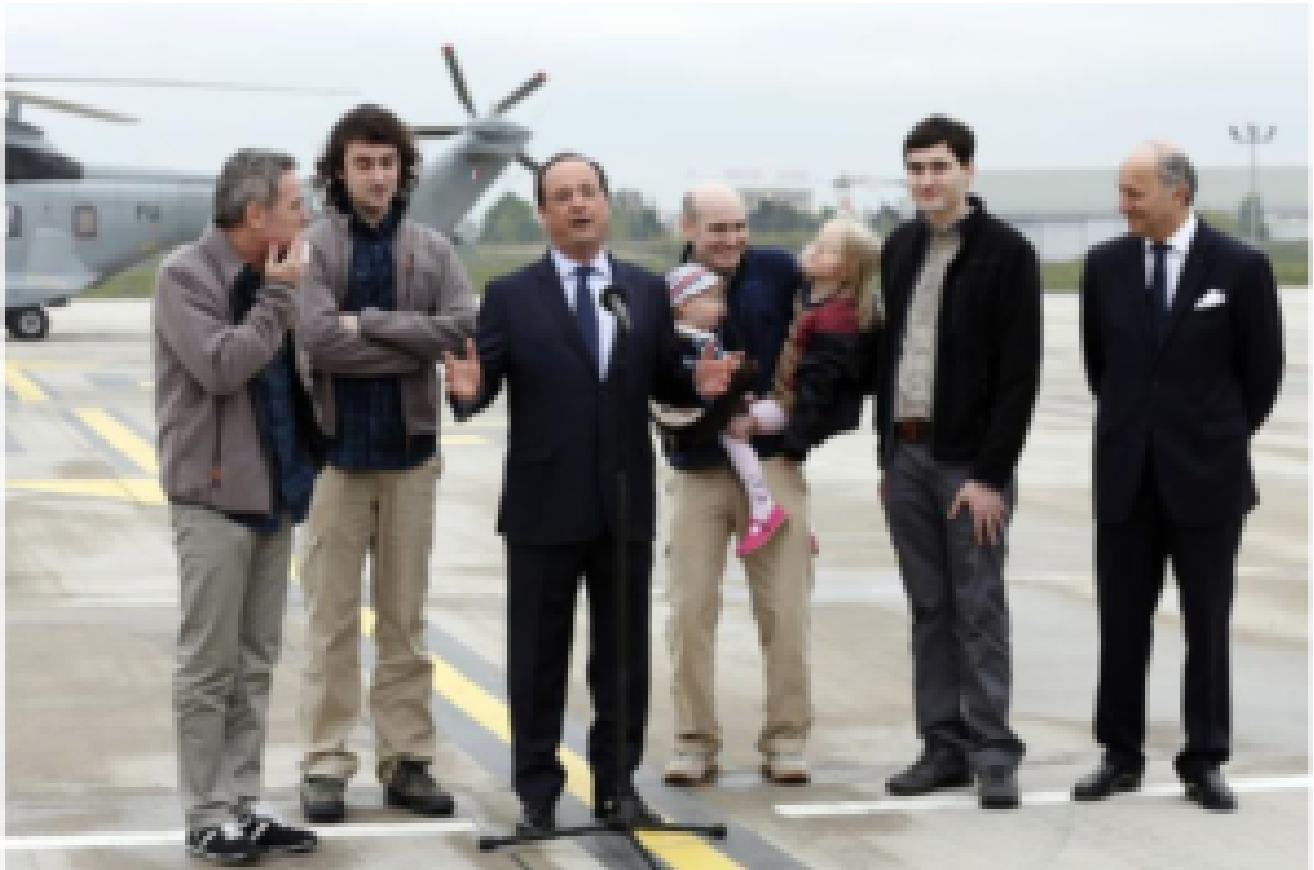
Le président François Hollande entouré des quatre ex-otages et de Laurent Fabius (droite) à l'aéroport de Villacoublay le 20 avril 2014