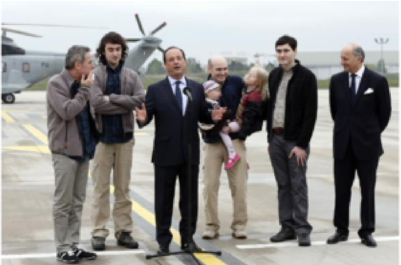
Le président François Hollande entouré des quatre ex-otages et de Laurent Fabius (droite) à l'aéroport de Villacoublay le 20 avril 2014