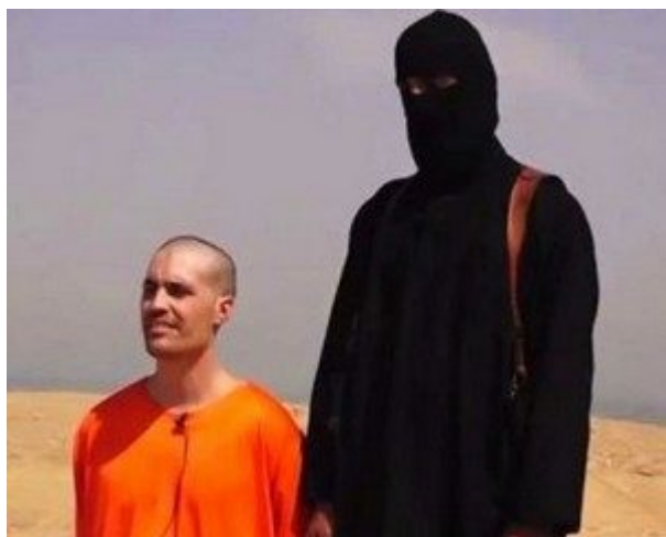
James Foley, dont les djihadistes ont filmé la décapitation