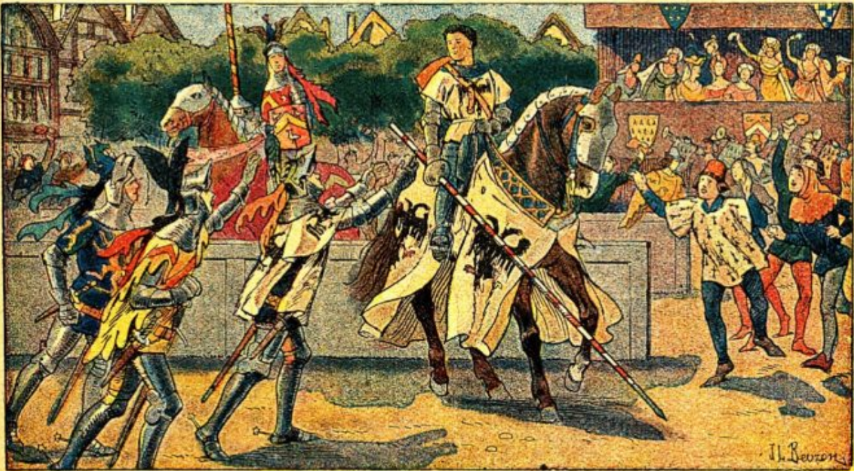
FIG. 34. — Duguesclin se fit connaître dans une fête par sa force et son adresse. Charles V le nomma chef de son armée.