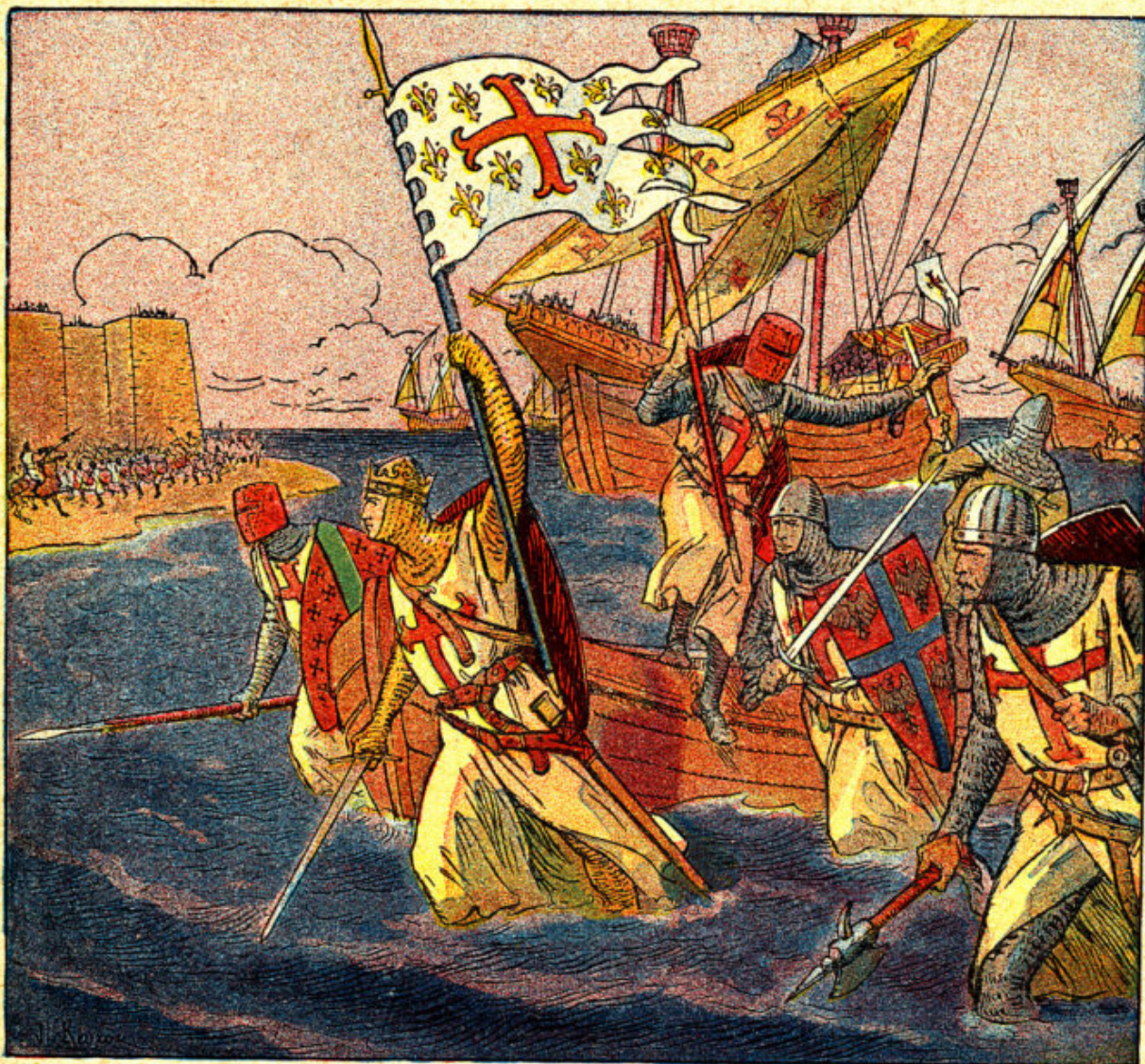
FIG. 30. — Louis IX quitta son royaume pour aller à la croisade en Afrique. Il mourut de la peste loin de la France.