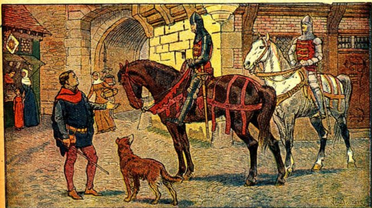
FIG. 35. — Duguesclin prisonnier répond au prince anglais : Chaque Française filera une quenouille pour payer ma liberté.