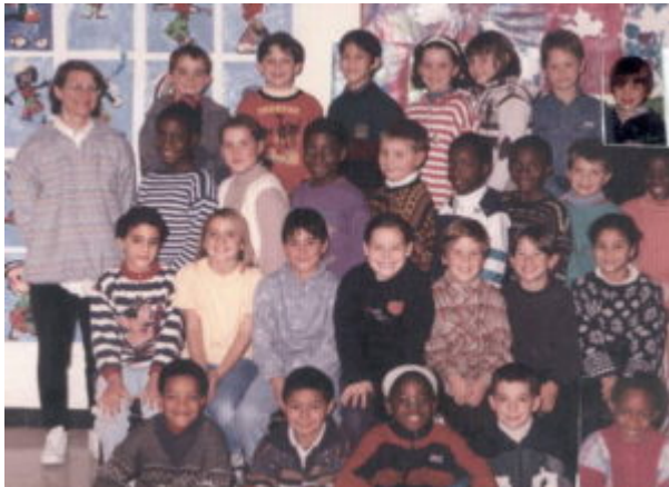
1995 – CE2 – Ecole les Rivières