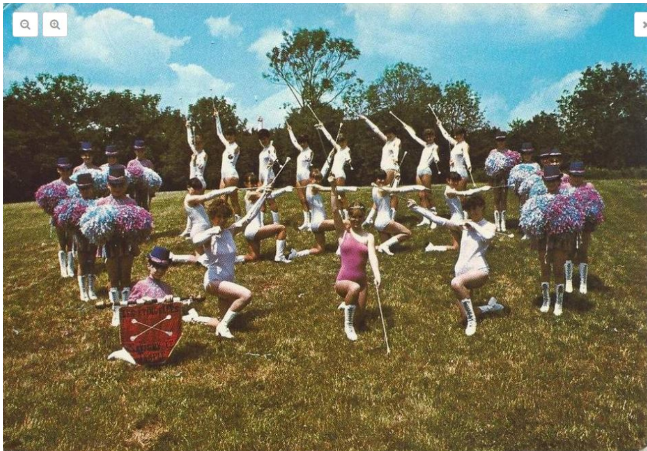
Le groupe de majorettes « Les étincelles », années 1980.