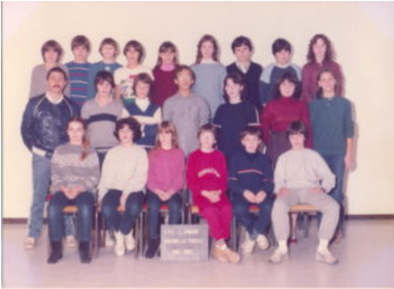
1983 – 5ème – Collège L. Armand