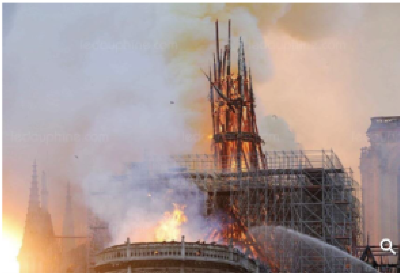
La flèche s'est effondrée sur elle-même.

– Ebra Presse (@EBRAPresse) 15 avril 2019