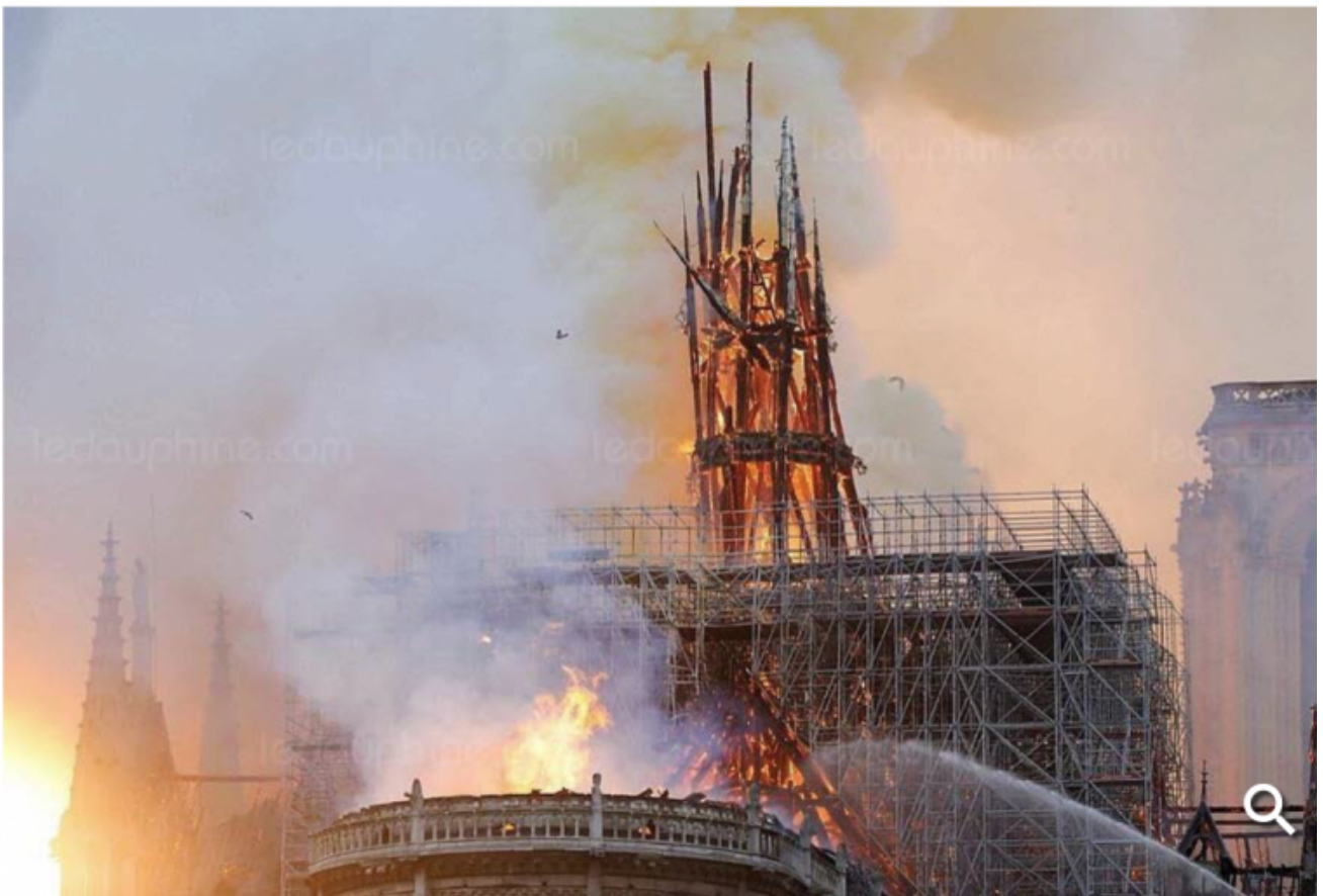
La flèche s'est effondrée sur elle-même.

écrit par Christine Tasin | 15 avril 2019