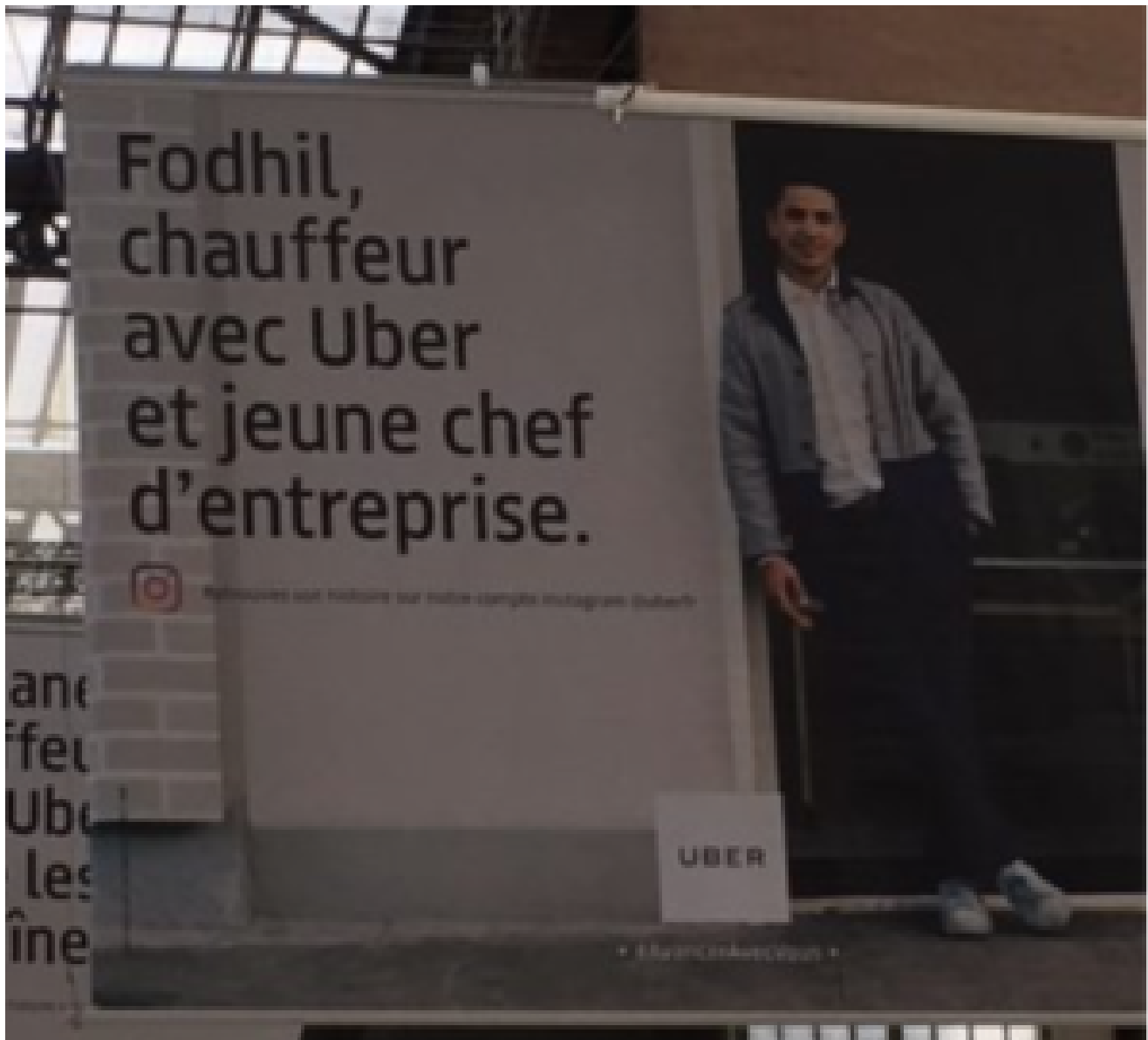
Et celles tout aussi culottées de la Gare Montparnasse :