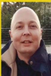
Secrétaire Général du Parti de la France