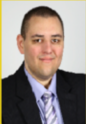
Secrétaire général du syndicat France Police