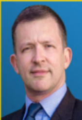
Conseiller régional apparenté RN Occitanie