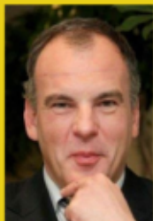
Président du Rassemblement des Contribuables Français