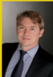
Avocat de Gilets jaunes