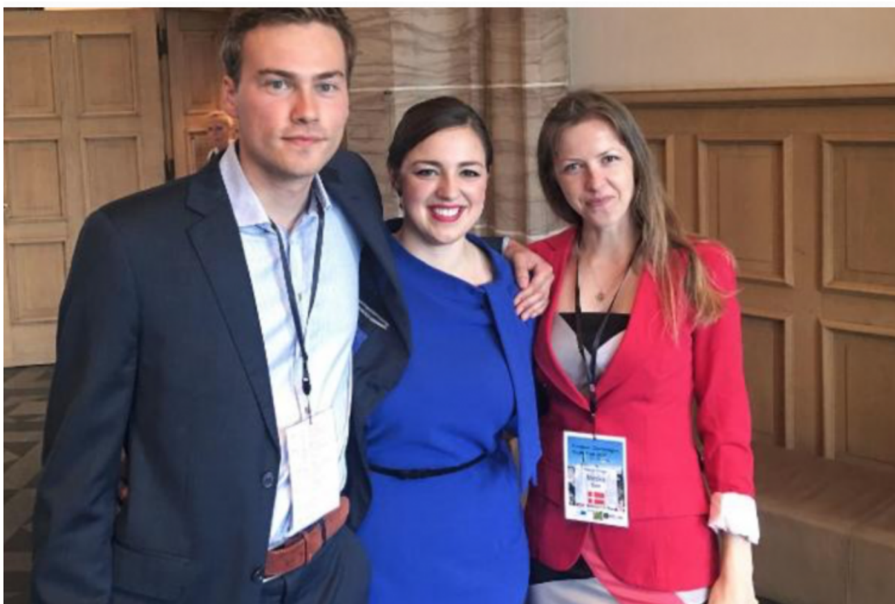
Les lauréats 2017 du prix Charlemagne pour la jeunesse européenne

Merci à Poum qui nous a signalé la forfaiture -attendue- des dhimmis de Bruxelles :